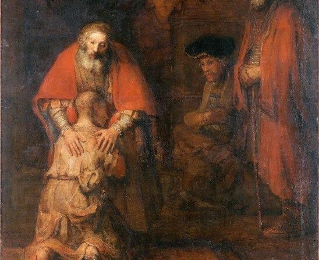
«Возвращение блудного сына», 1666-1669 Рембрандт