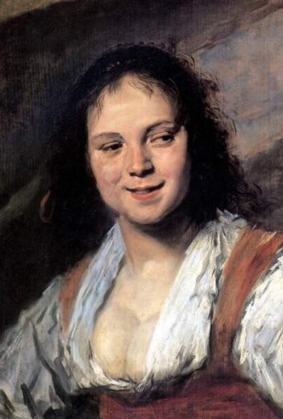
«Цыганка», 1628-1630 Франс Халс