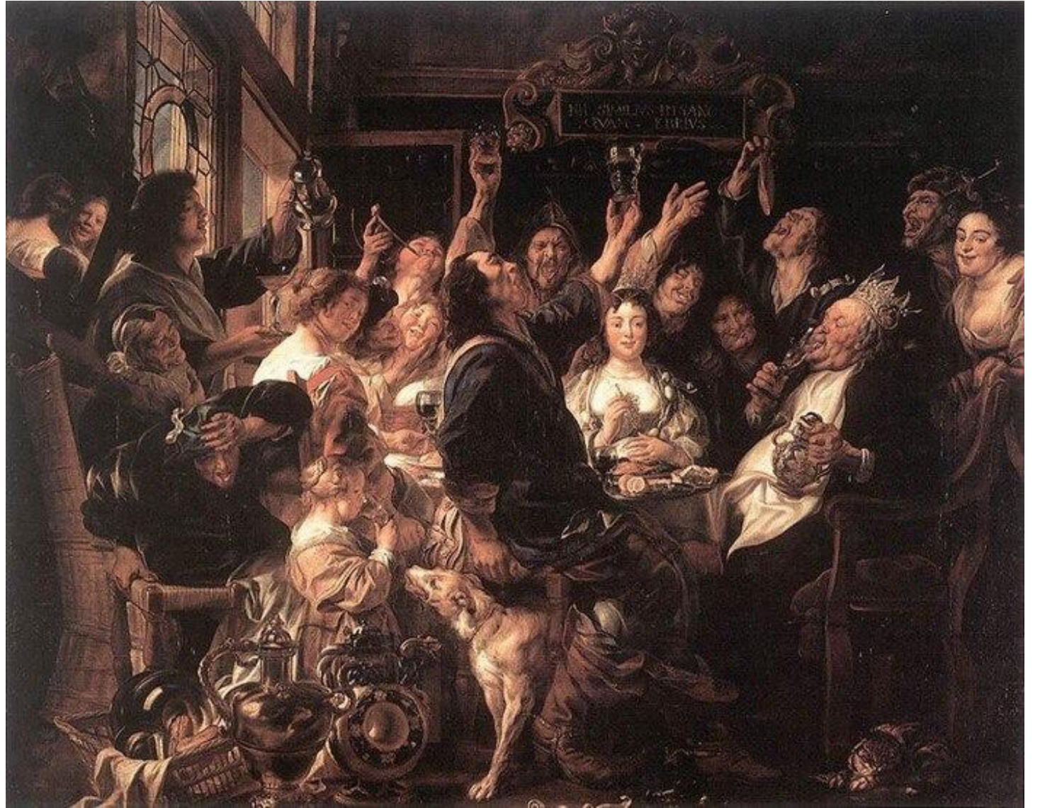
«Праздник бобового короля», 1655 Якоб Йорданс