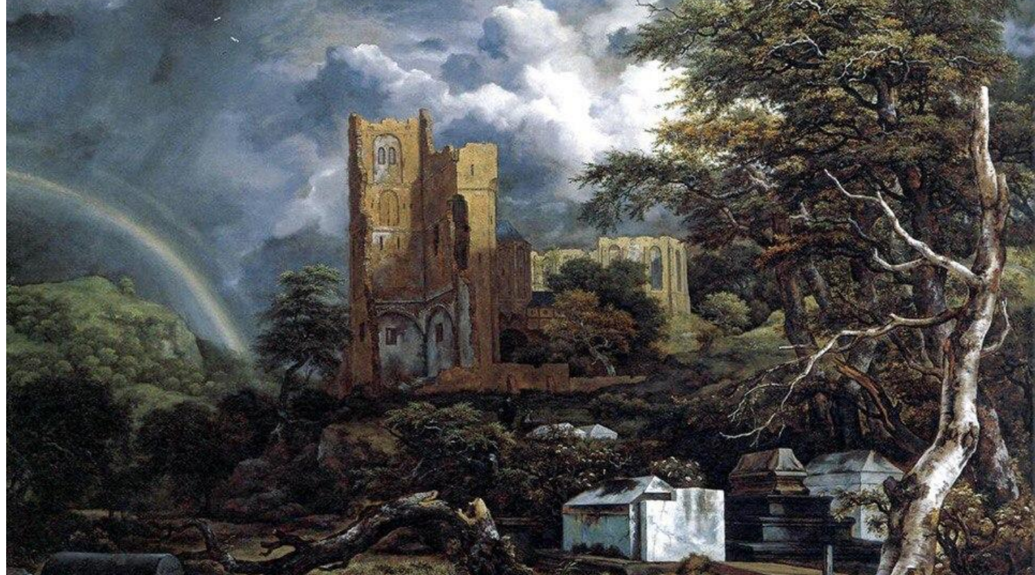
«Еврейское кладбище», 1657 Якоб ван Рёйсдал