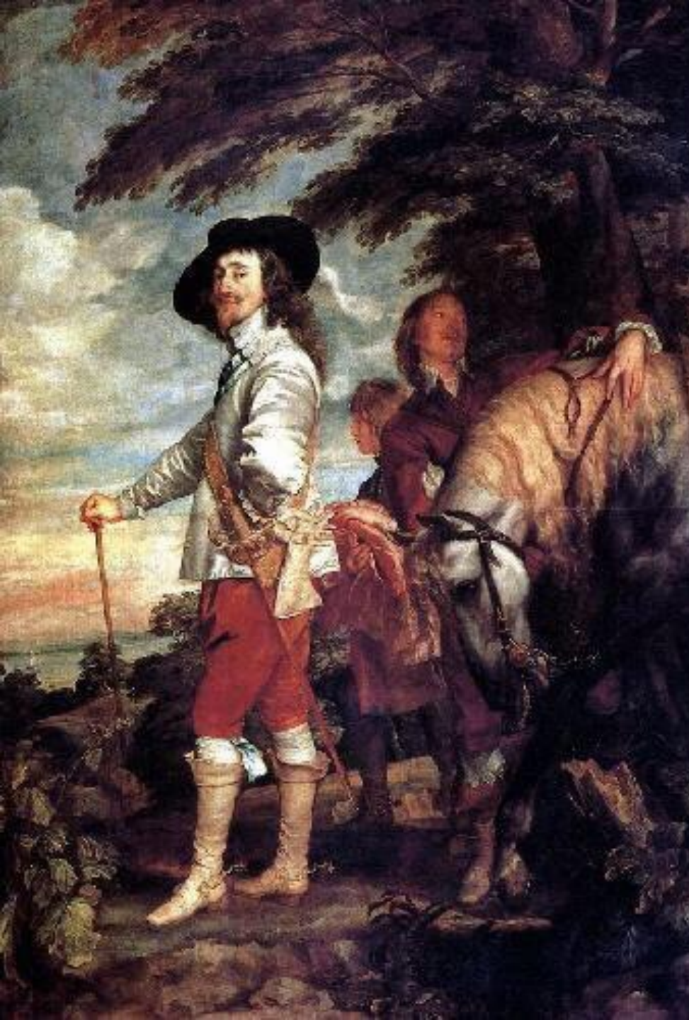
Антонис Ван Дейк «Портрет Карла I на охоте», 1635