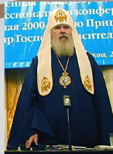
Восточная (православная) церковь