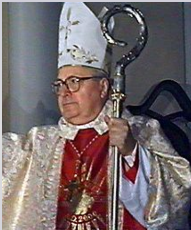
Западная (католическая) церковь