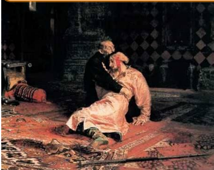
Иван Грозный и его сын Иван