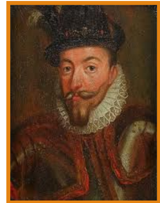
Шведский король Сигизмунд