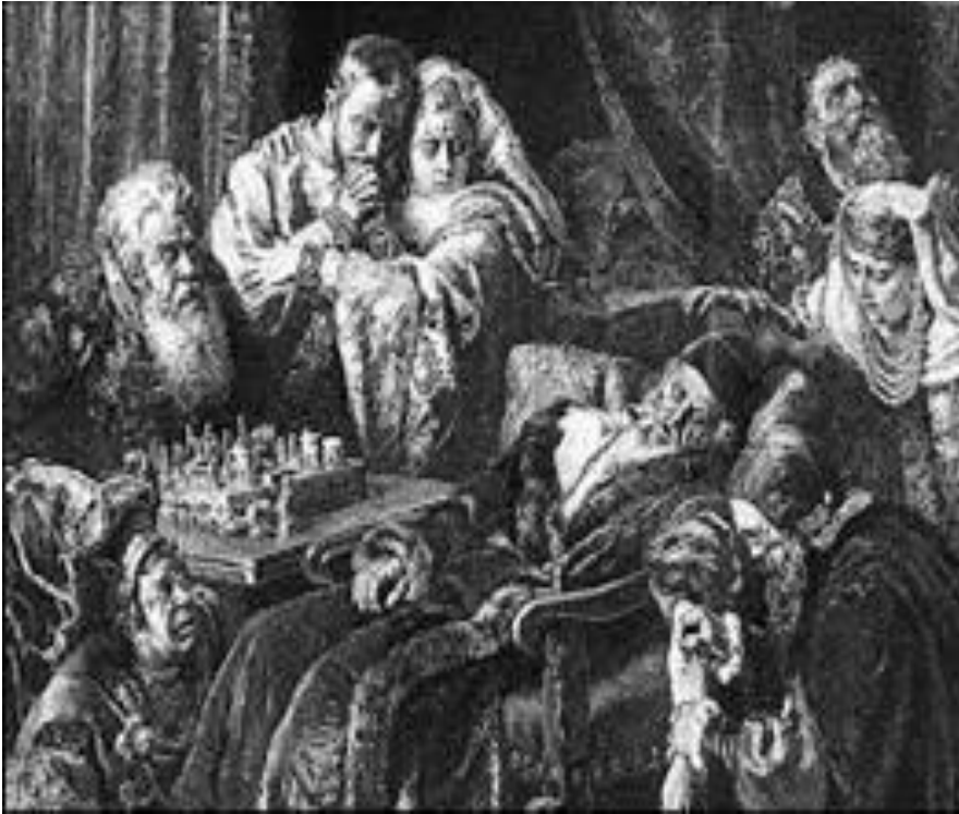
Смерть Ивана Грозного

Объективные итоги царствования Иван Грозный мог увидеть уже при жизни: это был провал всех внутри- и большинства внешнеполитических начинаний.