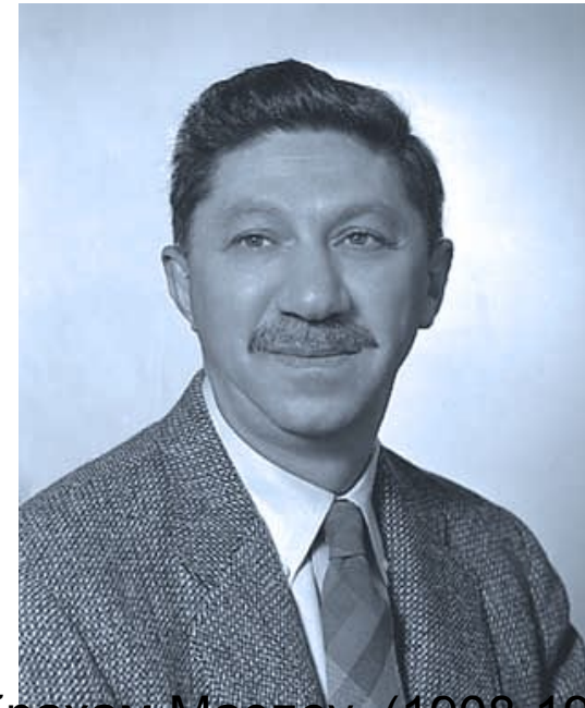
Абрахам Маслоу (1908-1970)

Удовлетворение потребностей, расположенных внизу иерархии, делает возможным осознание потребностей, расположенных выше в иерархии, и их участие в мотивации.