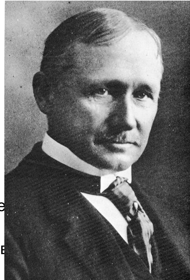
Фредерик Уинслоу Тейлор (1856-1915)