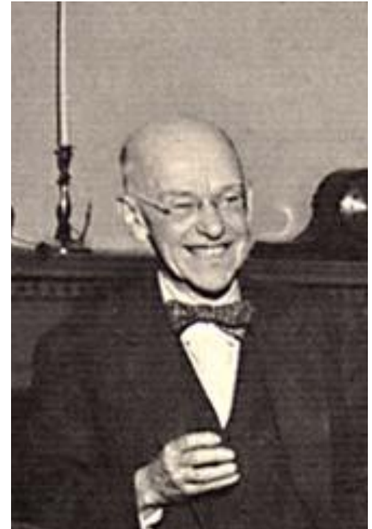
Элтон Мейо (1880-1949)