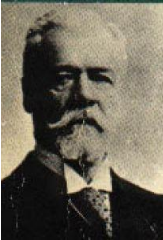
Анри Файоль (1841-1925)