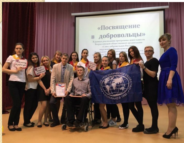
Посвящение в добровольцы

Знак «Географический центр Югры», установлен в 2016 г.