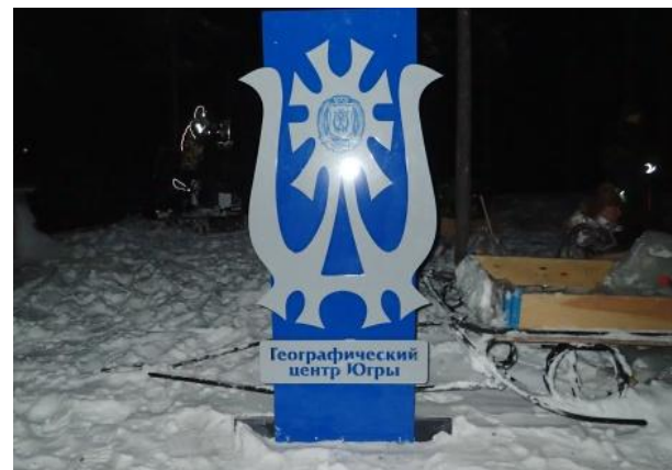
ГЕОГРАФИЧЕСКИЙ ДИКТАНТ В ХАНТЫ-МАНСИЙСКЕ (ЮГУ)