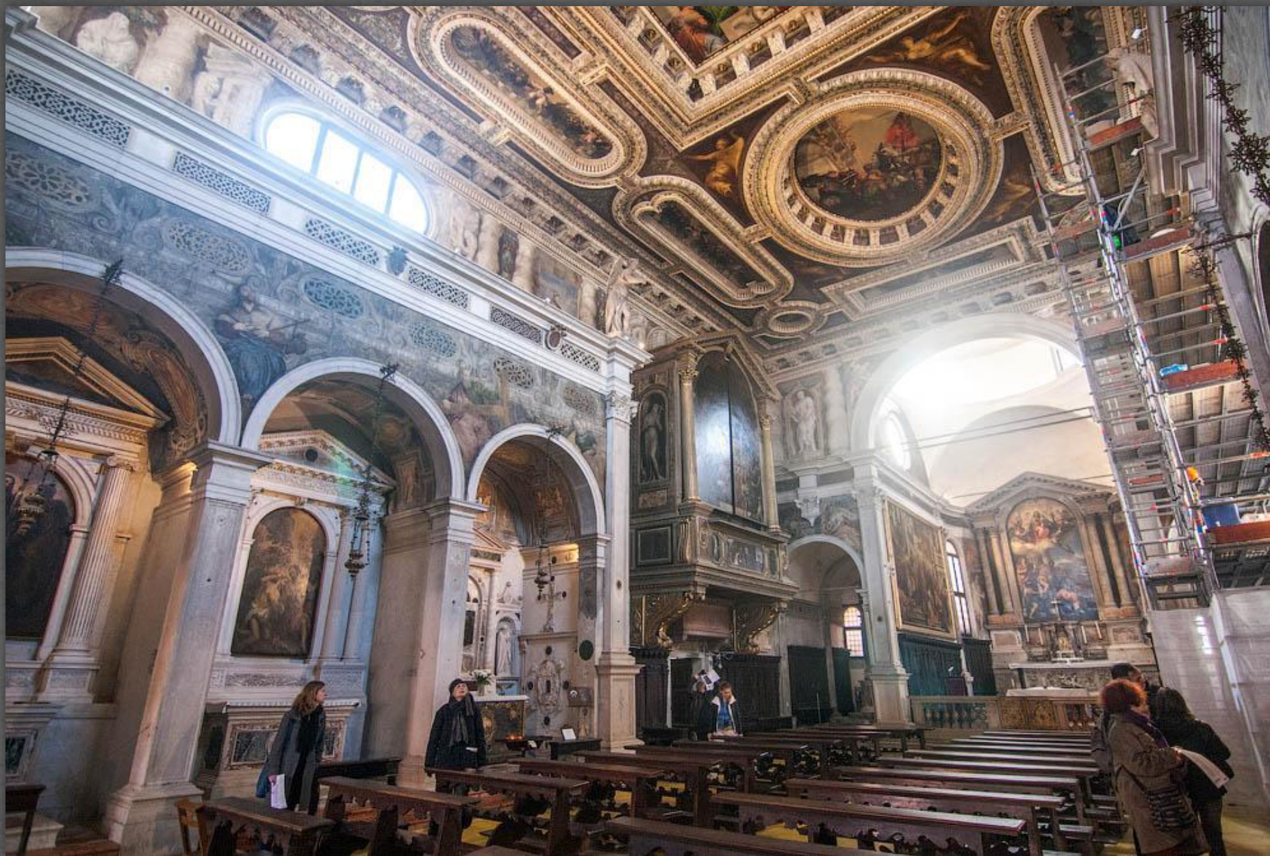
Потолок церкви Сан- Себастьяно