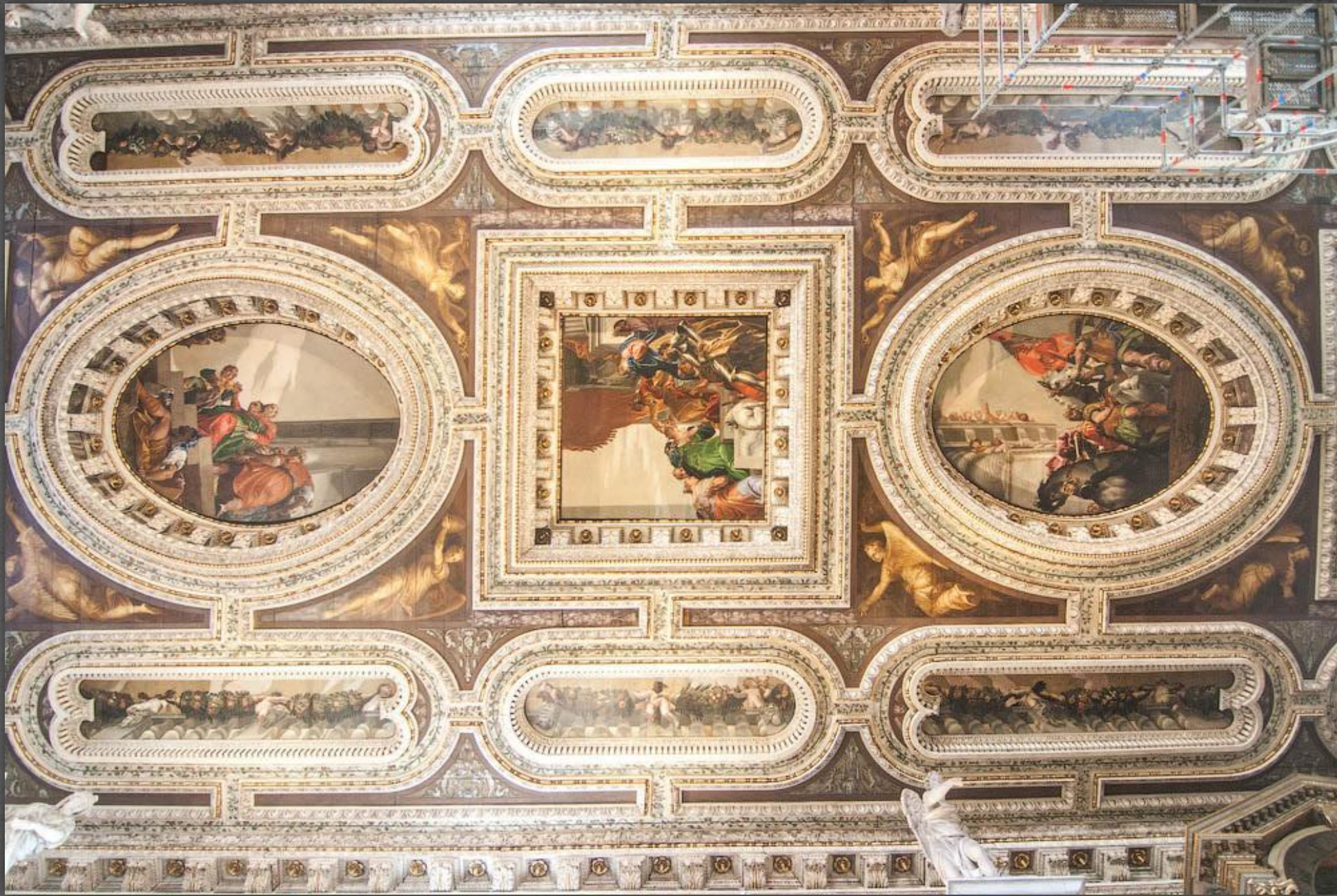
Потолок церкви Сан- Себастьяно