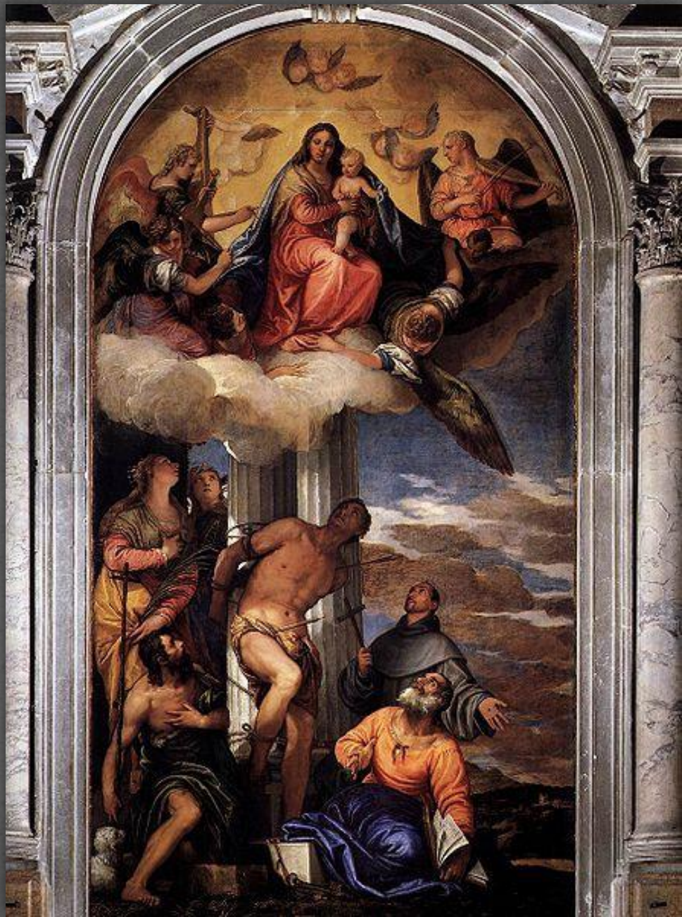
Мадонна с младенцем. Церковь Сан-Себастьяно, Венеция. Между 1564 и 1565 гг.