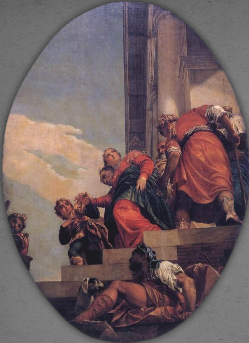
Изгнание царицы Астинь. Фрагмент.