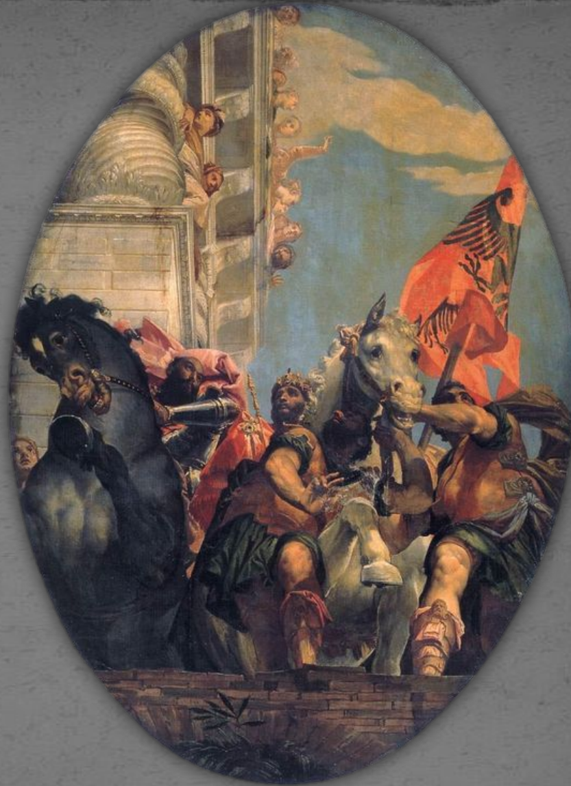
Триумф Мардохея. Фрагмент.