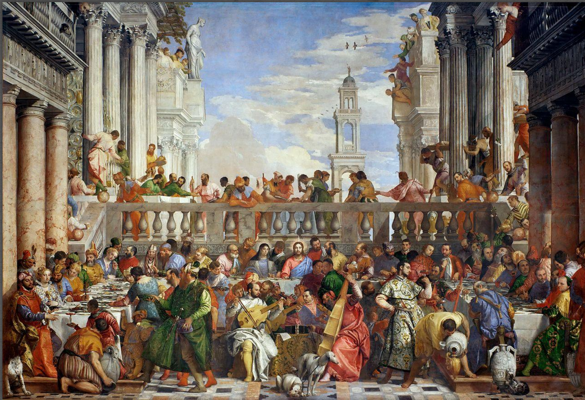
Брак в Кане Галилейско й. Лувр. 1562 – 1563 22.