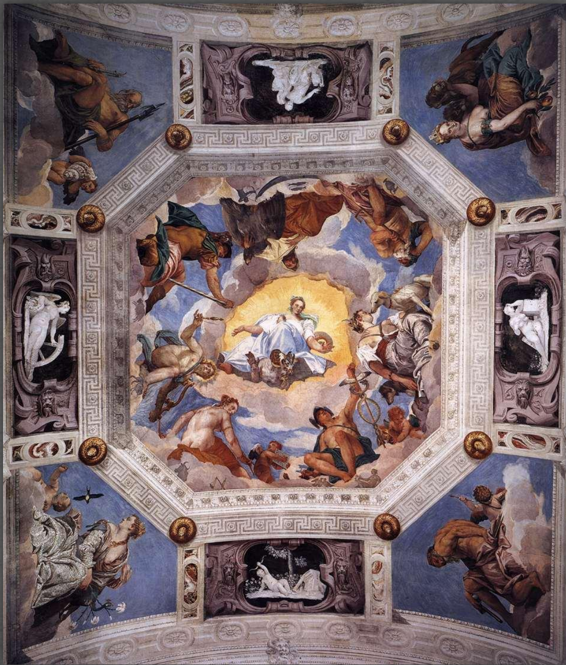
Потолок зала Олимпа. Вилла Барбаро-Вольпе в Мазаре. 1560 – 1561 гг.