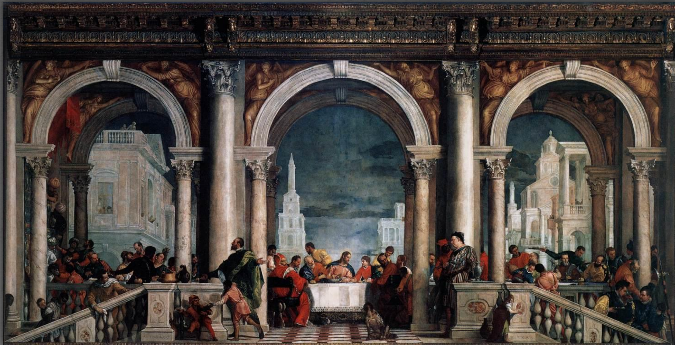
Пир в доме Ливия. Галерея Брера, Милан. 1570 г.