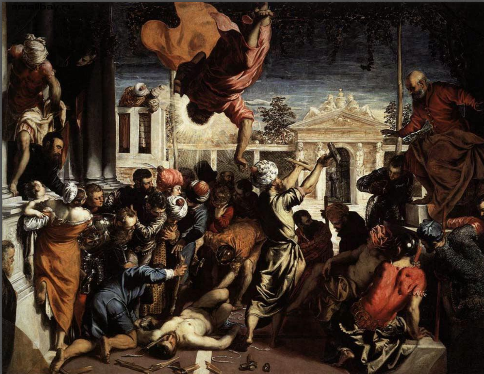
Чудо святого Марка. Галерея Академии, Венеция. 1548 г.