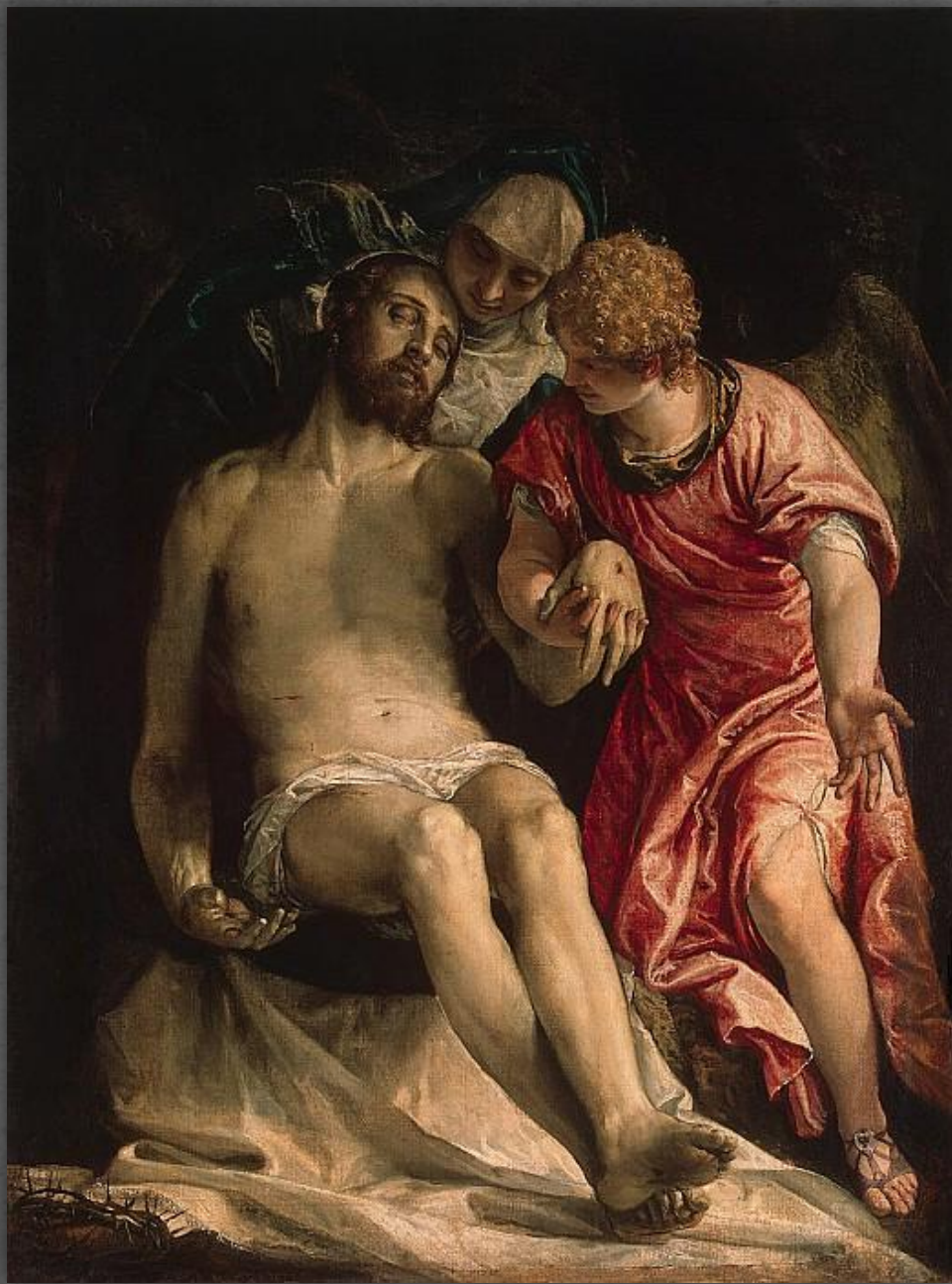
Оплакивание Христа. Эрмитаж. XVI в.