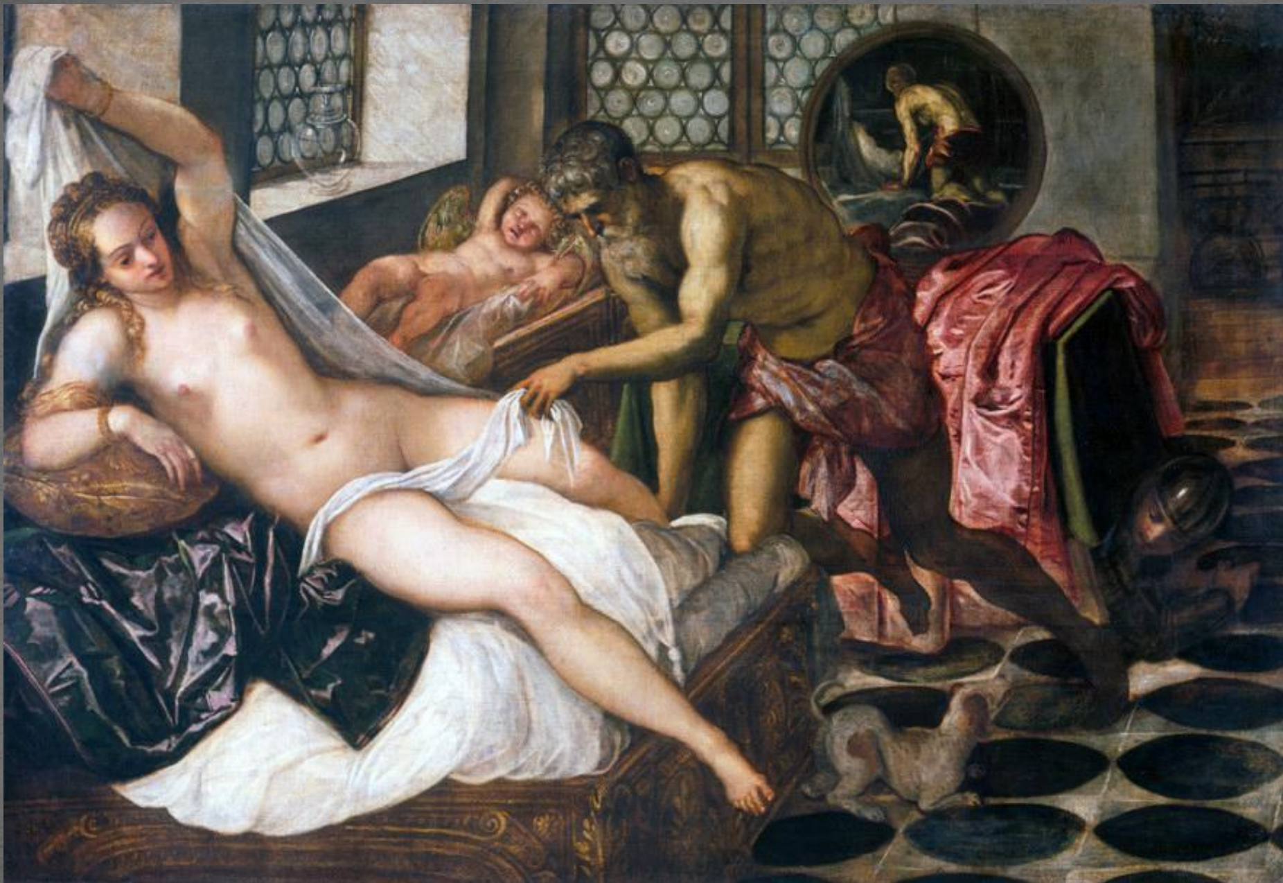
Венера, Вулкан и Марс. Старая Пинакотека, Мюнхен. 1547 - 1551 гг.