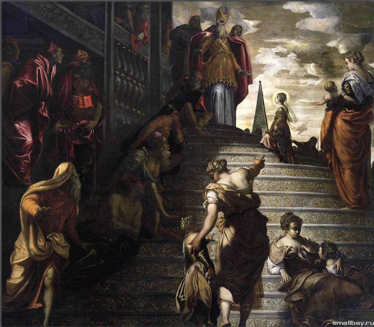
Введение во храм. Церковь Санта-Мария дель Орто, Венеция. 1555 г.