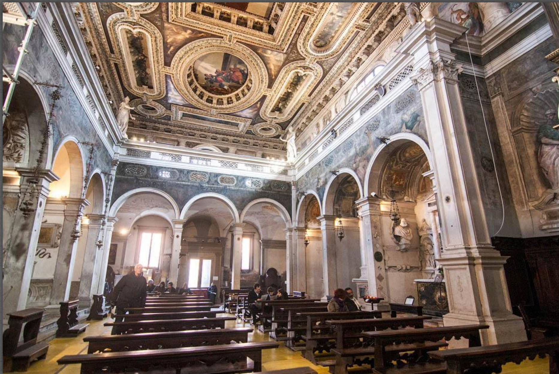
Потолок церкви Сан- Себастьяно