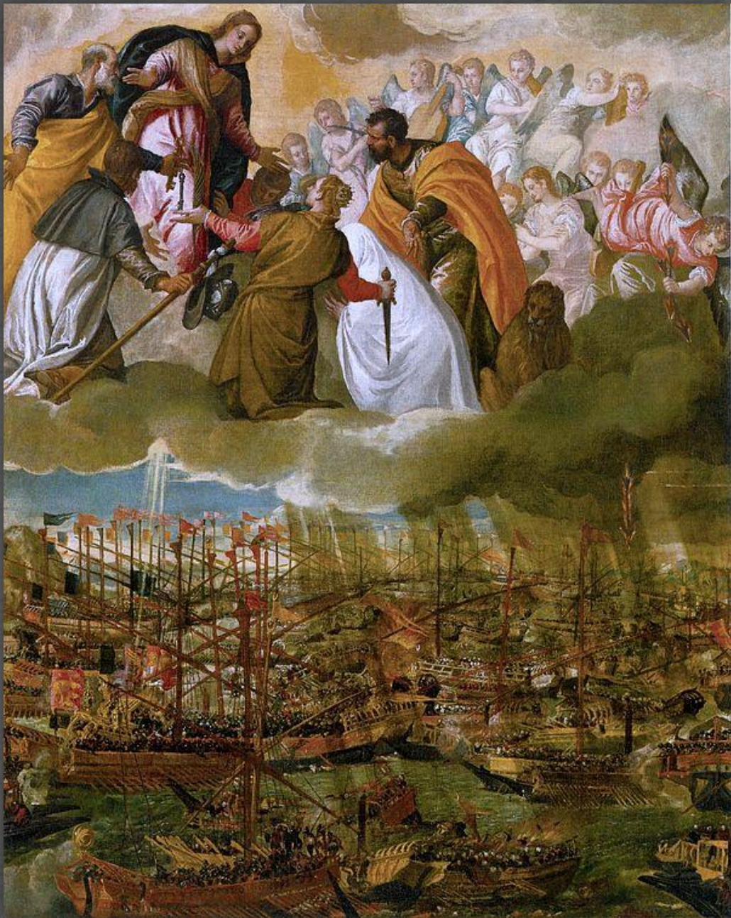
Битва при Лепанто. Галерея Академии (Венеция), Венеция. 1572 г.