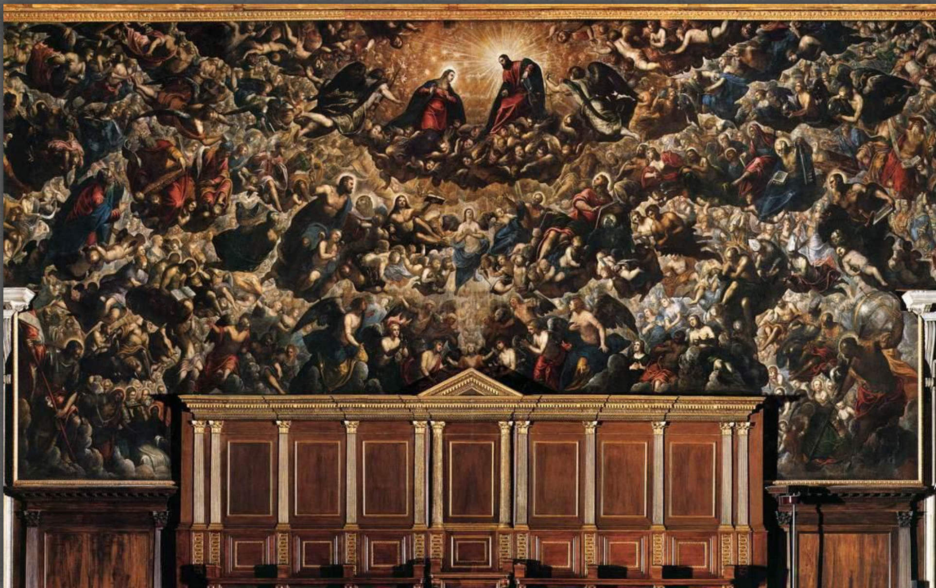
Рай. Дворец Дожей, Венеция. 1578 – 1588