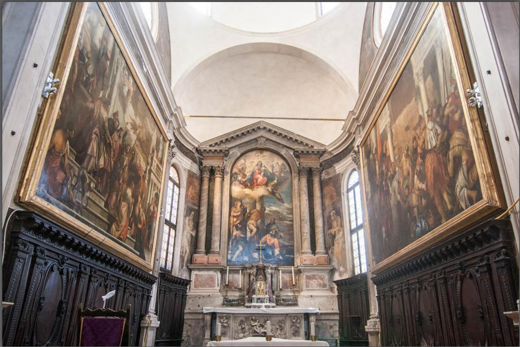
Алтарь церкви Сан-Себастьяно.