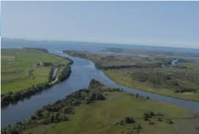
Дельта реки Неман

Область богата реками. Всего по территории области протекает 148 рек длиной более десяти километров. Крупные реки: Неман (с притоком Шешупе) и Преголя (с притоком Лава). Многочисленные озера. Самое большое озеро Виштынецкое.