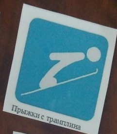
Прыжки с трамплина