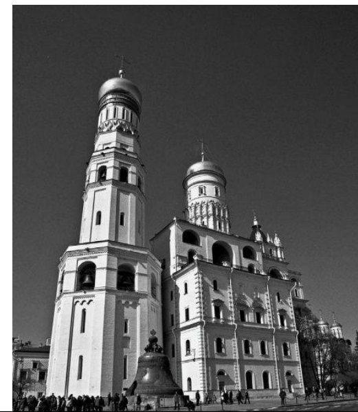
церковь Иоанна Лествичника