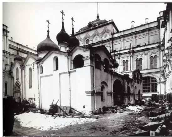
Собор спаса в Бору