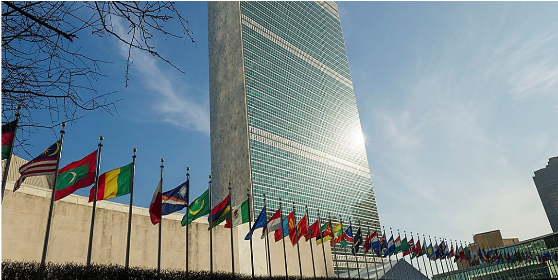
Комплекс Централных учреждений ООН в Нью-Йорке

история деятельности международной организации