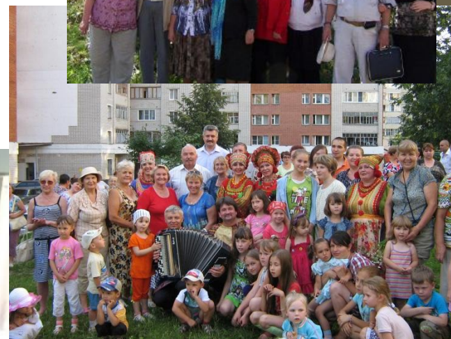
Организация досуга: экскурсии, праздники, спортивные мероприятия