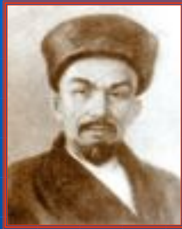
Каюм Насыри (1825 – 1902)