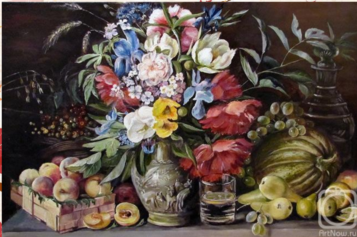
«Цветы и плоды» художника Ивана Трефиловича Хруцкого.

Все предметы в картине И.Т. Хруцкого подобраны очень продуманно. Расположив их вдоль края мраморного стола и подчеркнув светом передний план, художник сразу же наметил зрительный центр картины. Это ваза с цветами. В богатом по краскам подборе явно преобладают цветы светлой окраски, особенно желтые. Желтый цвет преобладает внизу по краям и вверху в центре.