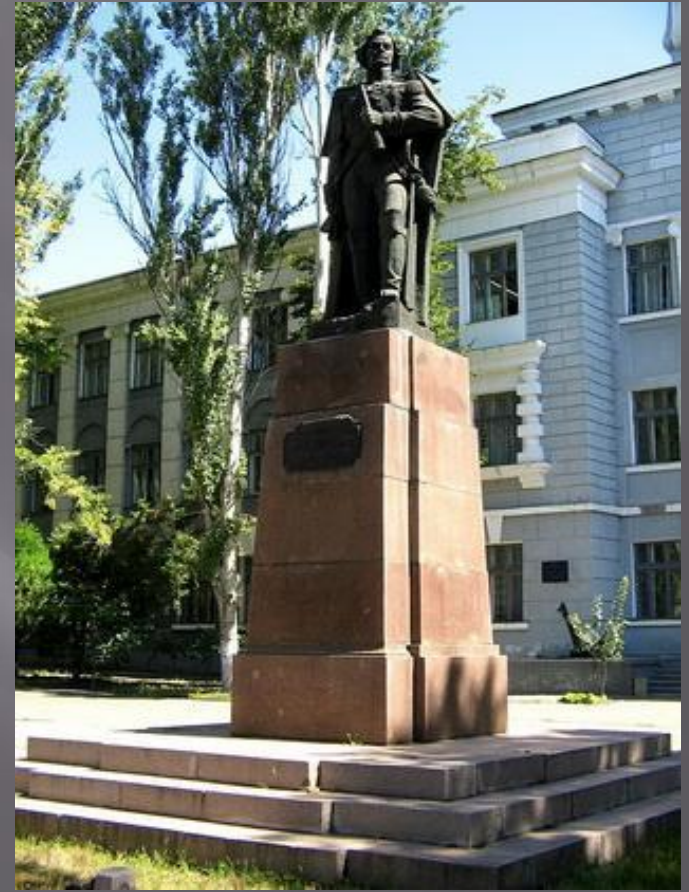
Памятник Ушакову Ф.Ф. в Херсонесе.