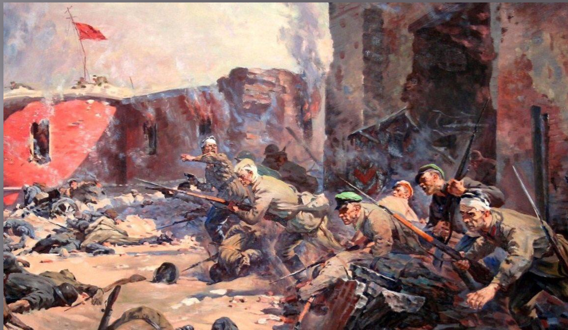
П. Кривоногое. «Защитники Брестской крепости».

Защитники верили: вот-вот к ним на помощь прорвутся наши части. Но помощь не приходила... Уже после войны на стене одной из казарм нашли едва различимую нацарапанную надпись: «Я умираю, но не сдаюсь. Прощай, Родина!» А внизу дата - «20 июля 1941». очевидцы рассказывают, что даже в начале августа в крепости раздавалась стрельба.