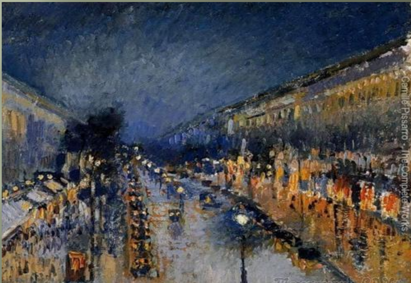
Бульвар Монмартр ночью