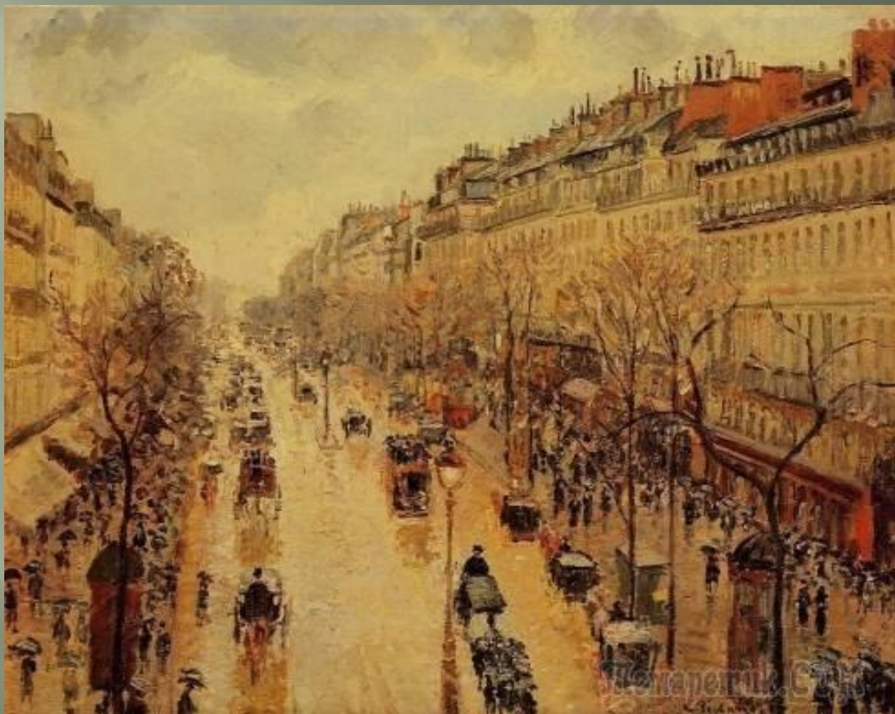
Бульвар Монмартр во второй половине дня. Дождь.