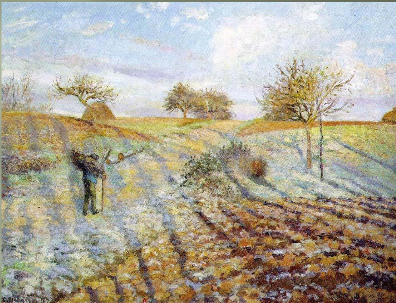
"Старая дорога из Аннери в Понтуаз. Заморозки"