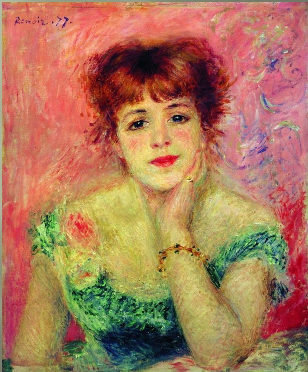
«Портрет Жанны Самари»