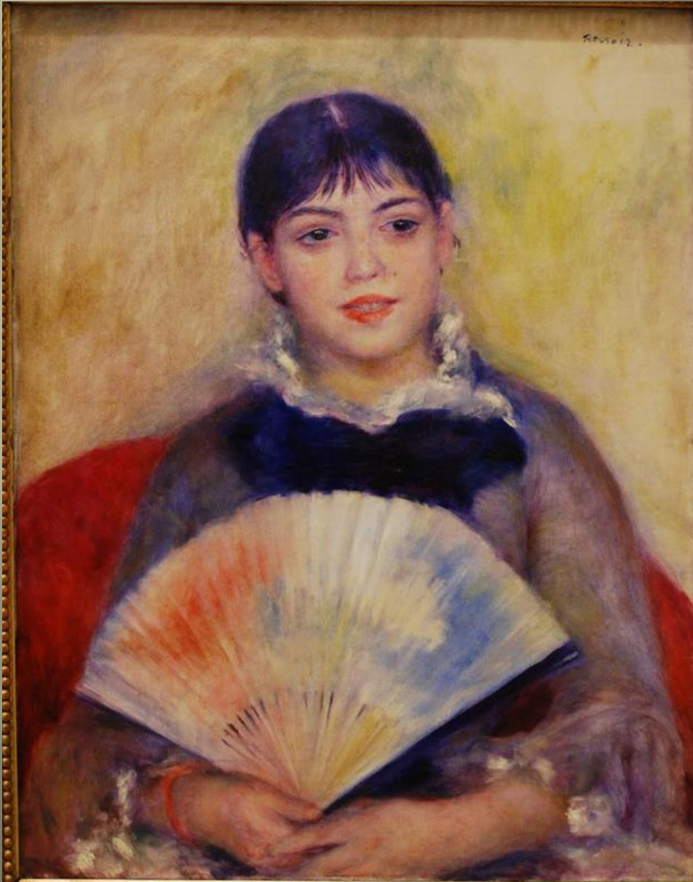
«Девушка с веером»