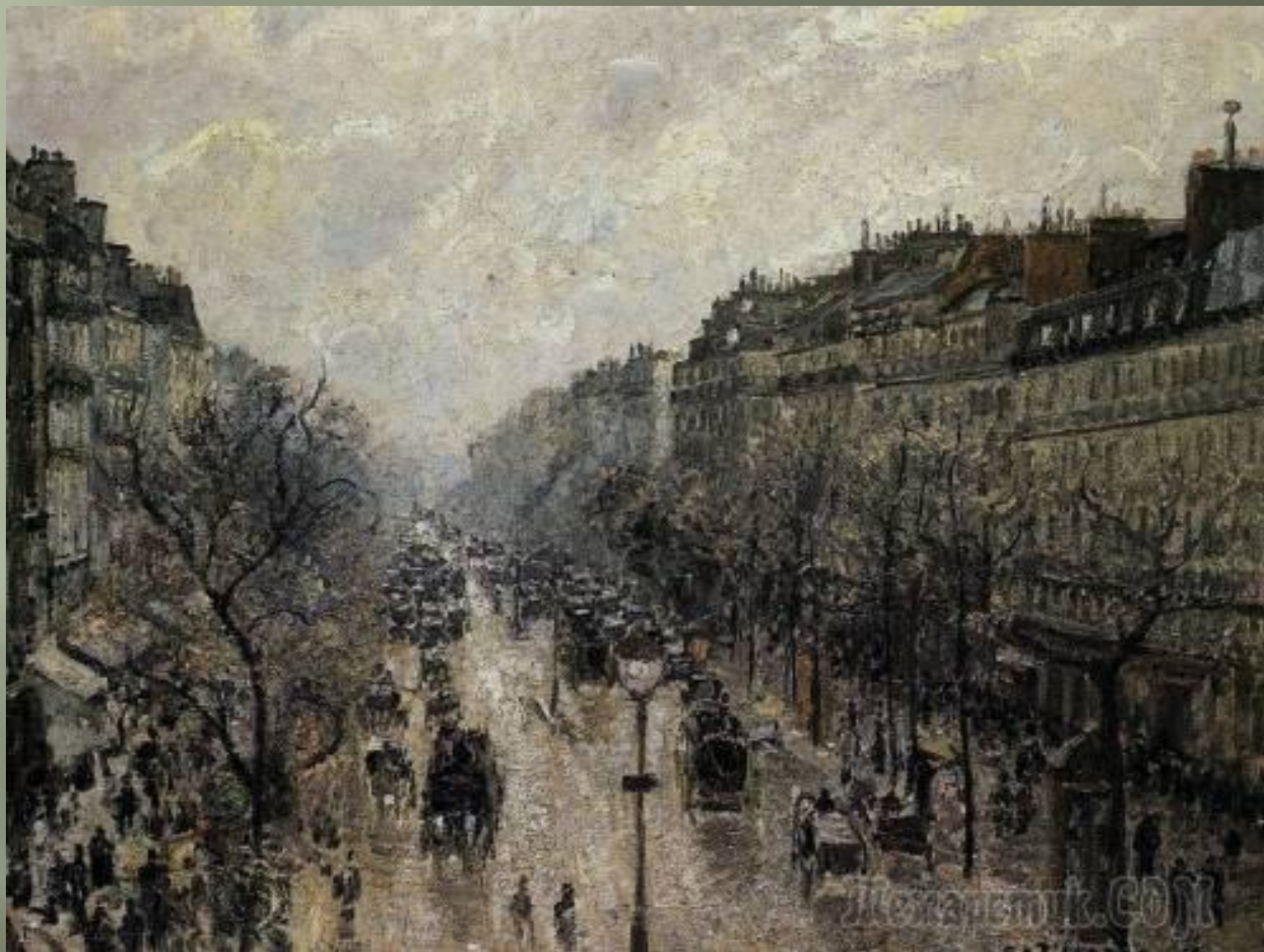
Бульвар Монмартр туманным утром.