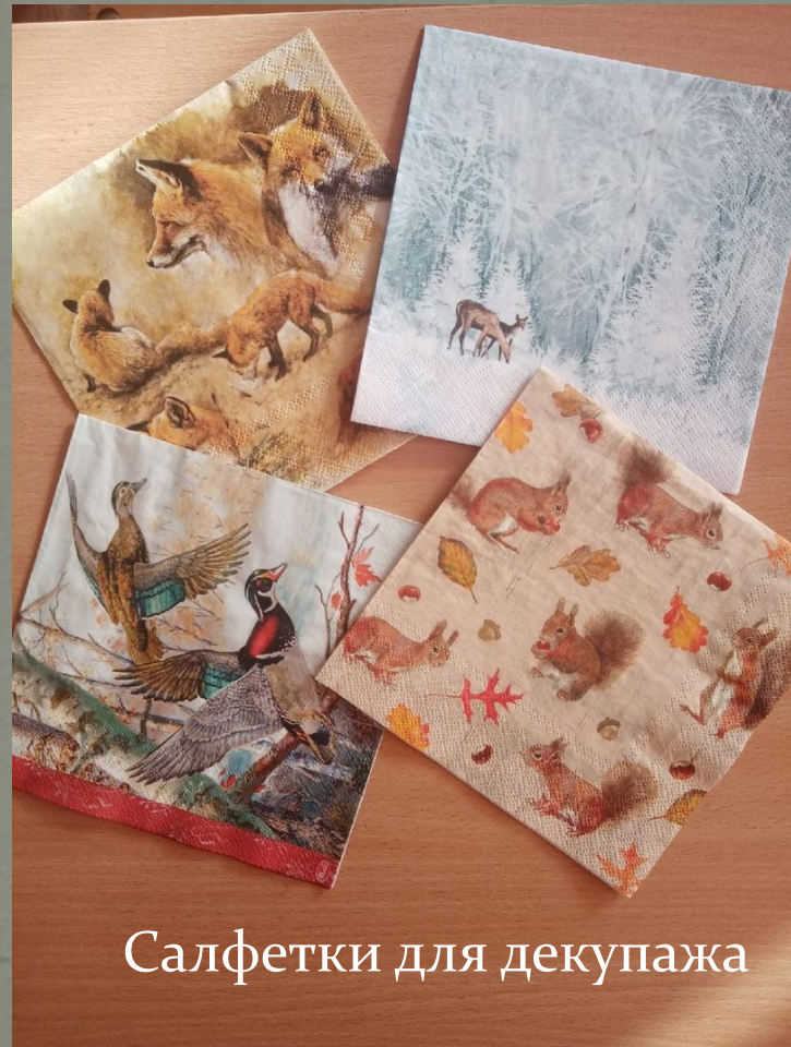
Салфетки для декупажа