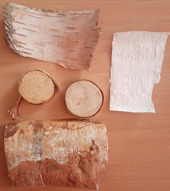
Береста, спилы дерева