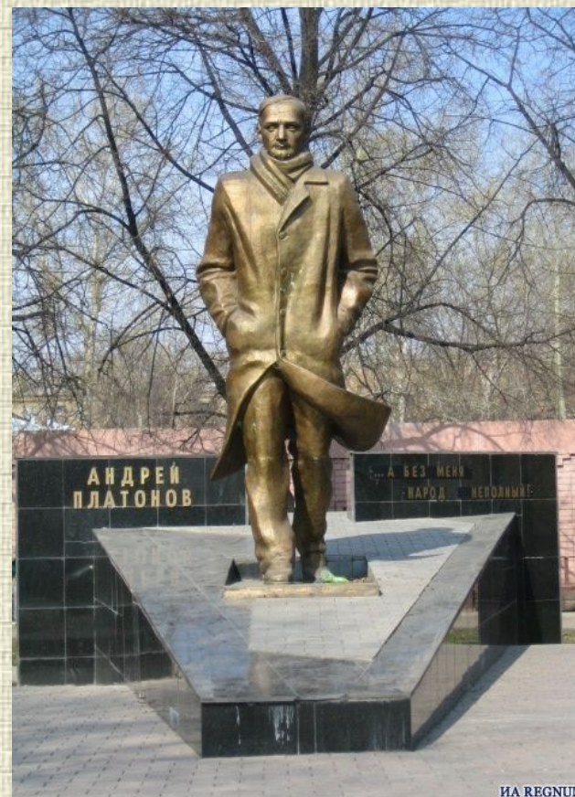
Памятник на родине писателя в городе Воронеже