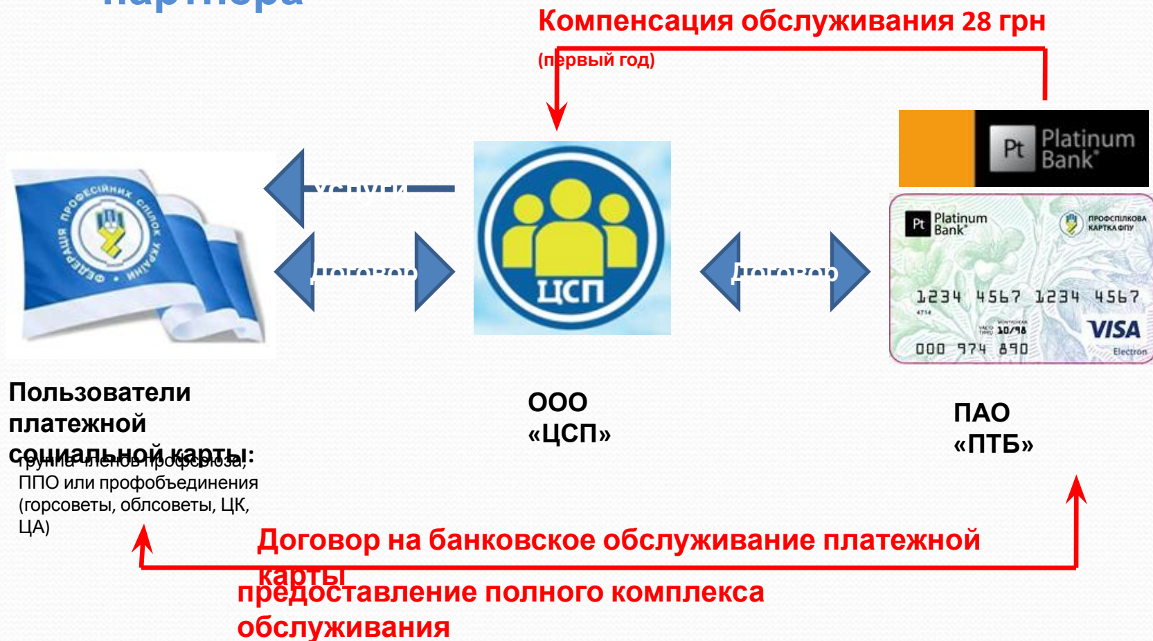
Схема работы с участием финансового партнера