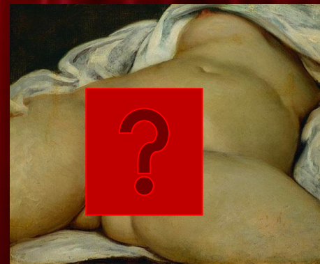
«ПРОИСХОЖДЕНИЕ МИРА» (1866 Г.)