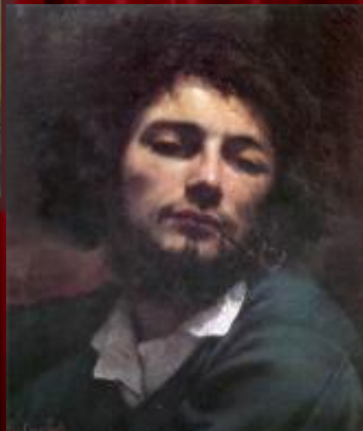
"Автопортрет (Мужчина с трубкой)". 1848-49 гг.