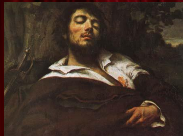
"Раненый человек" 1844-54 гг.