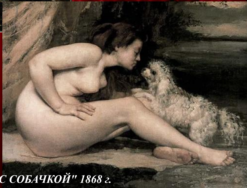
"ОБНАЖЕННАЯ С СОБАЧКОЙ" 1868 г.