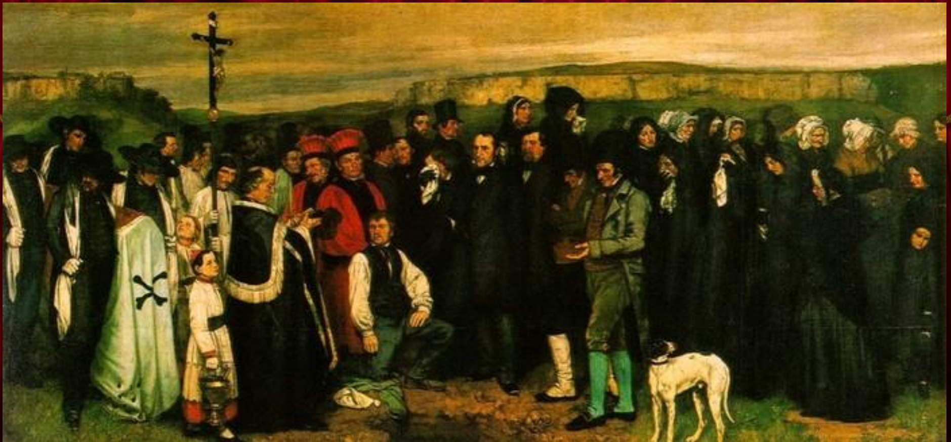
"ПОХОРОНЫ В ОРНАНЕ" (1849-1850гг.)

Курбе подвергся яростной критике, а его картина стала объектом многочисленных карикатурных пародий