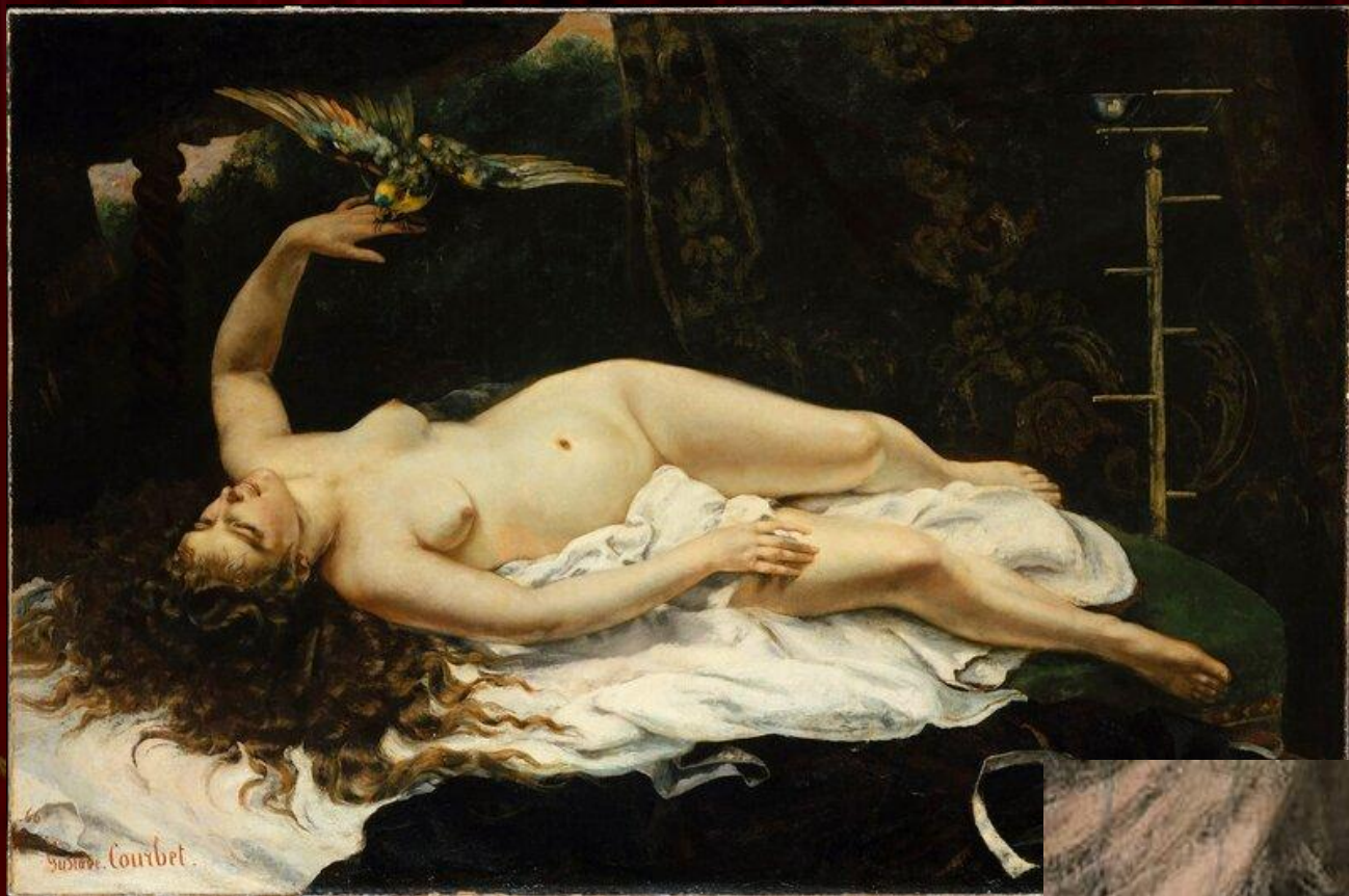
"ЖЕНЩИНА С ПОПУГАЕМ"