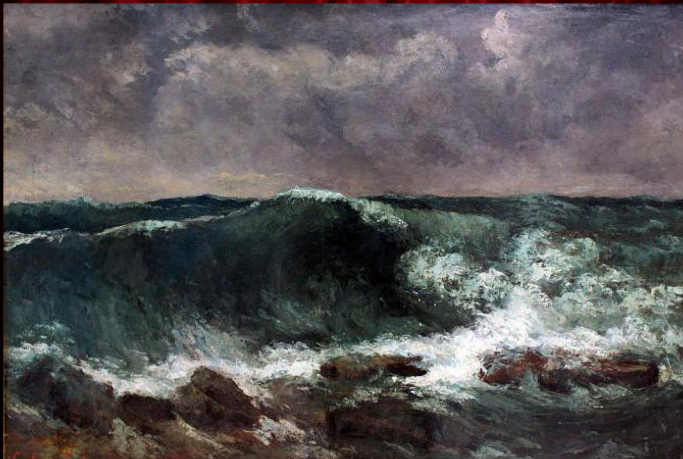
«ВОЛНА» (1870 г.)

Э. Золя писал: «Это был удивительный мастер: крепость фактуры, непогрешимость техники остаются непревзойденными в нашей школе. Надо обратиться к итальянскому Возрождению, чтобы найти такую уверенную и сильную кисть»