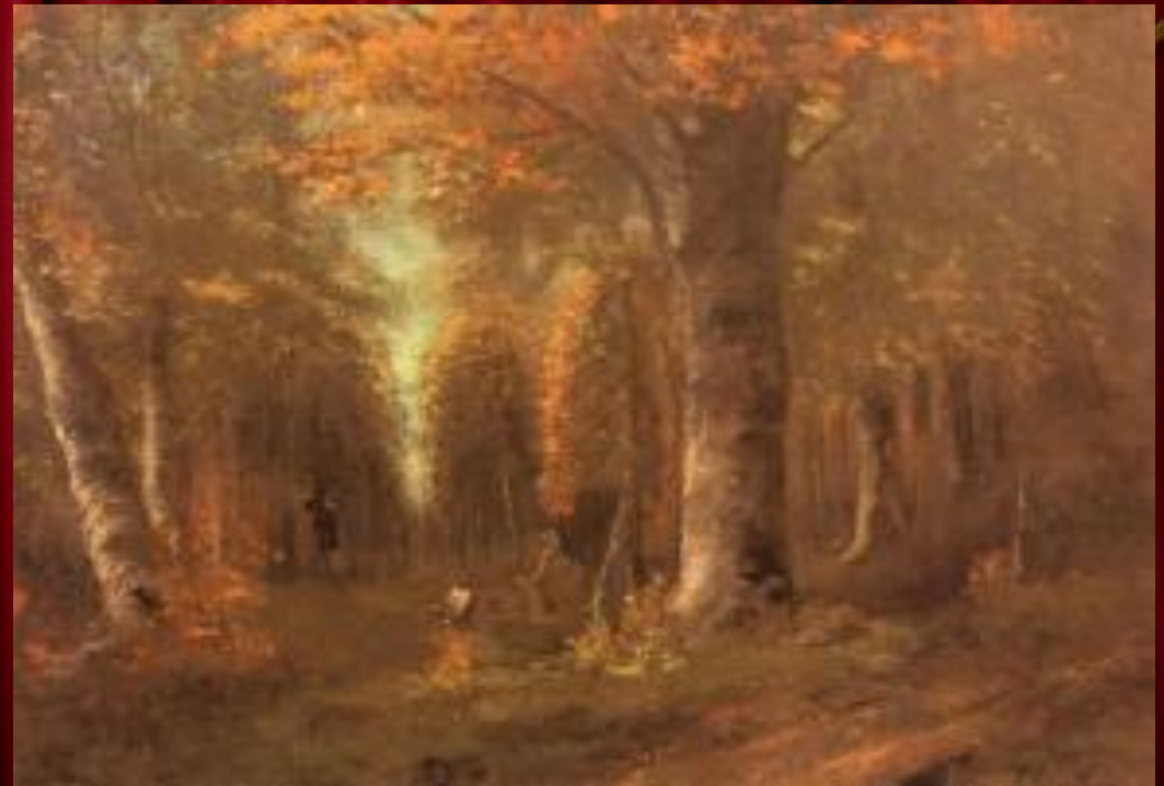
«ЛЕС ОСЕНЬЮ» 1841 г.