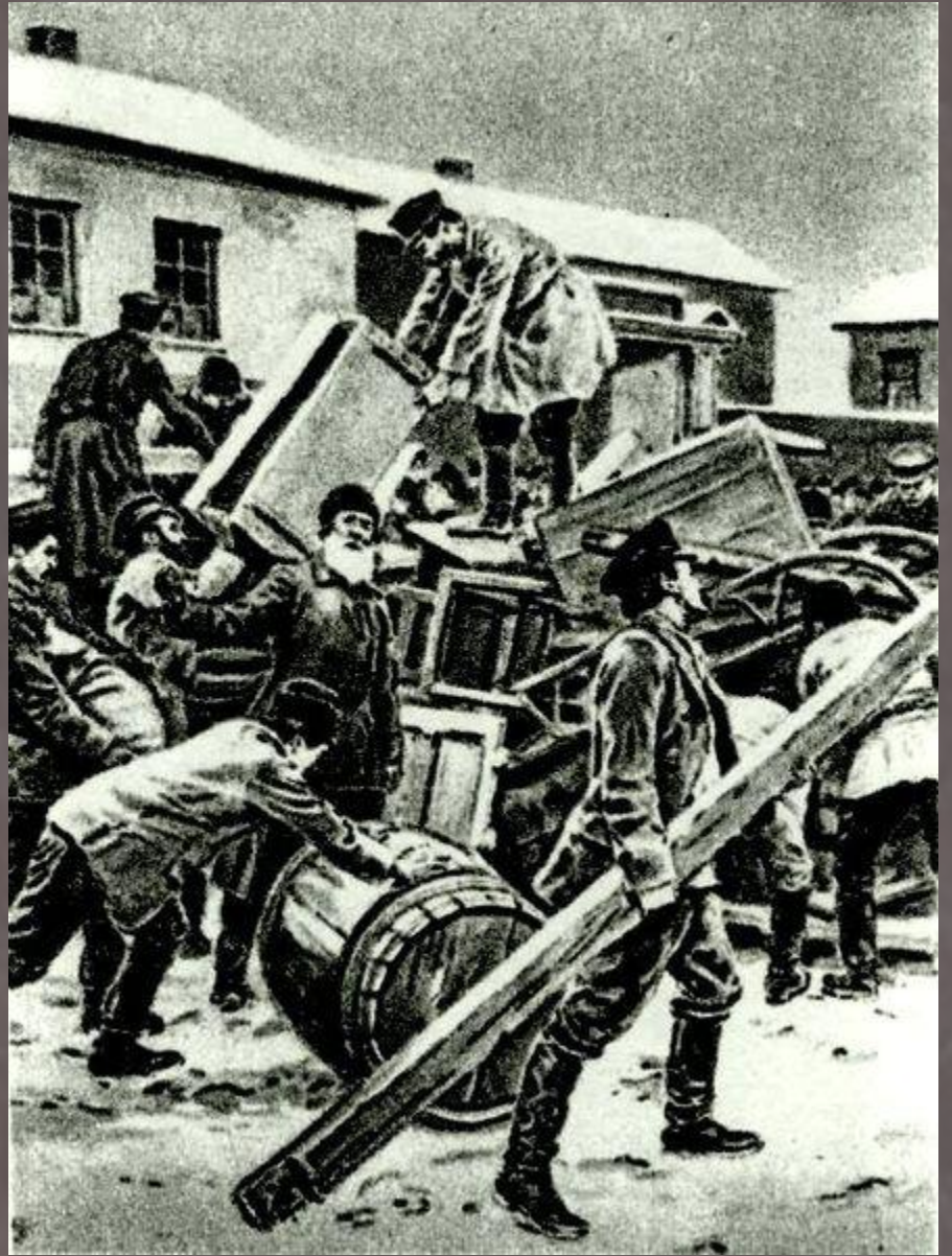
Строительство баррикад на Васильевском острове 9 января 1905 года.

Утром 9 (22) января собравшиеся в рабочих районах Петербурга — за Нарвской и Невской заставами, на Выборгской и Петербургской стороне, на Васильевском острове и в Колпино — многолюдные колонны начали своё движение к Дворцовой площади в центре города. Их общая численность доходила до 140 тысяч человек