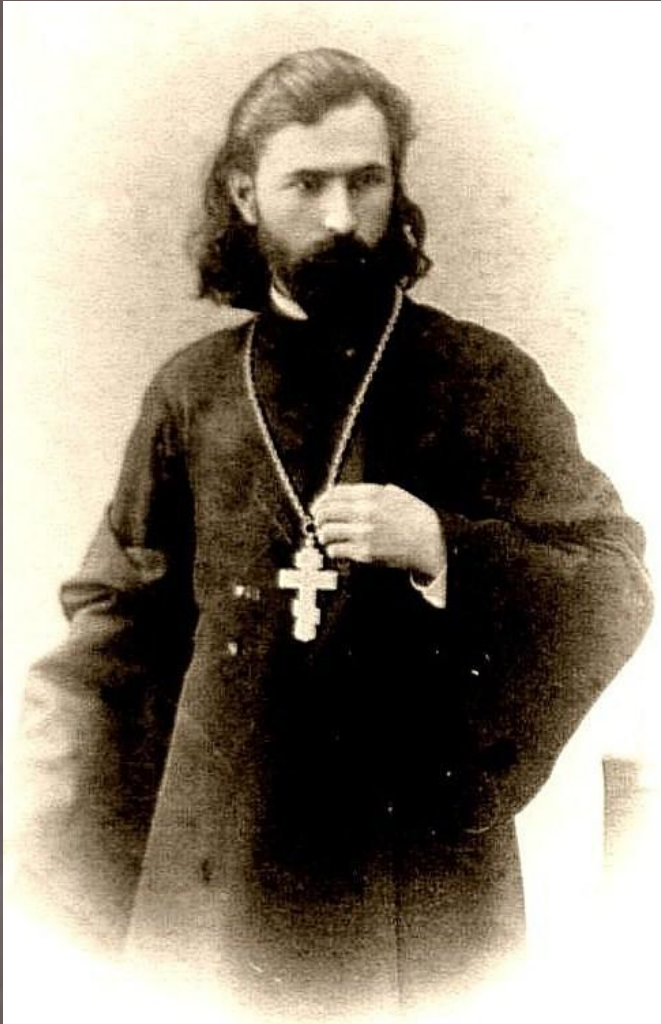
Священник Георгий Гапон

Родные товарищи-рабочие! Итак, у нас больше нет царя! Неповинная кровь легла между ним и народом. Да здравствует же начало народной борьбы за свободу! Благословляю вас всех. Сегодня же буду у вас. Сейчас занят делом.