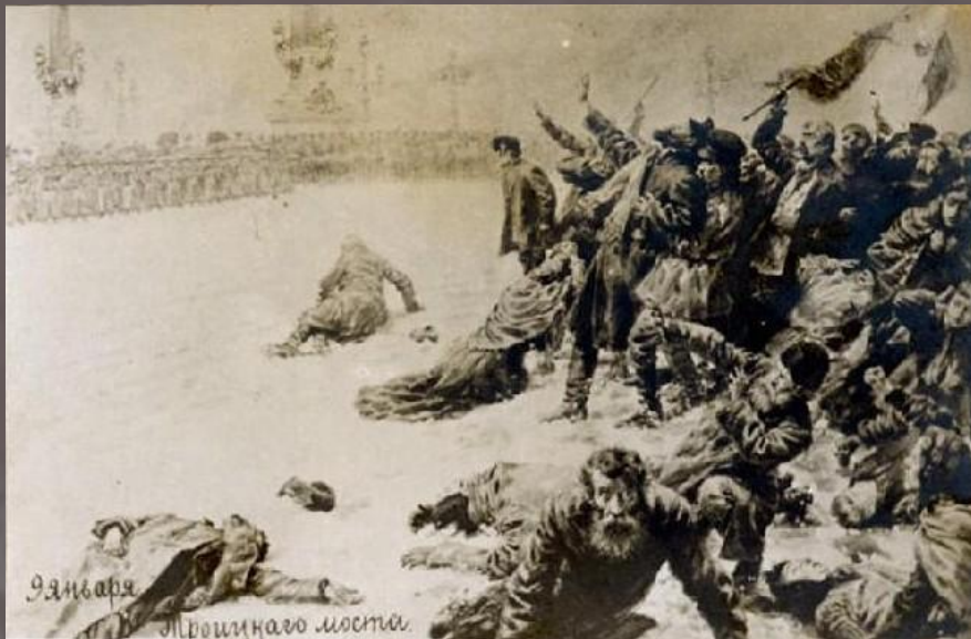
Рисунок неизвестного художника "9 января. У Троицкого моста".

Политический характер выступления и стремление демонстрантов прорваться сквозь оцепление солдат стали причиной разгона шествия, в ходе которого против безоружных рабочих было применено огнестрельное оружие. Разгон шествия, повлёк гибель более нескольких сотен человек. После разгона шествия у Нарвской заставы священник Гапон был уведён с площади группой рабочих и эсером П. М. Рутенбергом. Во дворе ему остригли волосы и переодели в штатскую одежду, а затем спрятали на квартире Максима Горького. По свидетельству очевидцев, Гапон был шокирован расстрелом манифестации. Он сидел, глядя в одну точку, нервно сжимал кулак и повторял: «Клянусь... Клянусь...» Придя в себя, он попросил бумагу и