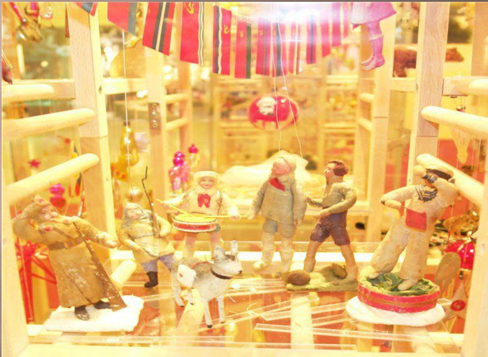
Артели «Ёлочная игрушка» и «Коопроводник» – ватные и бумажные игрушки.