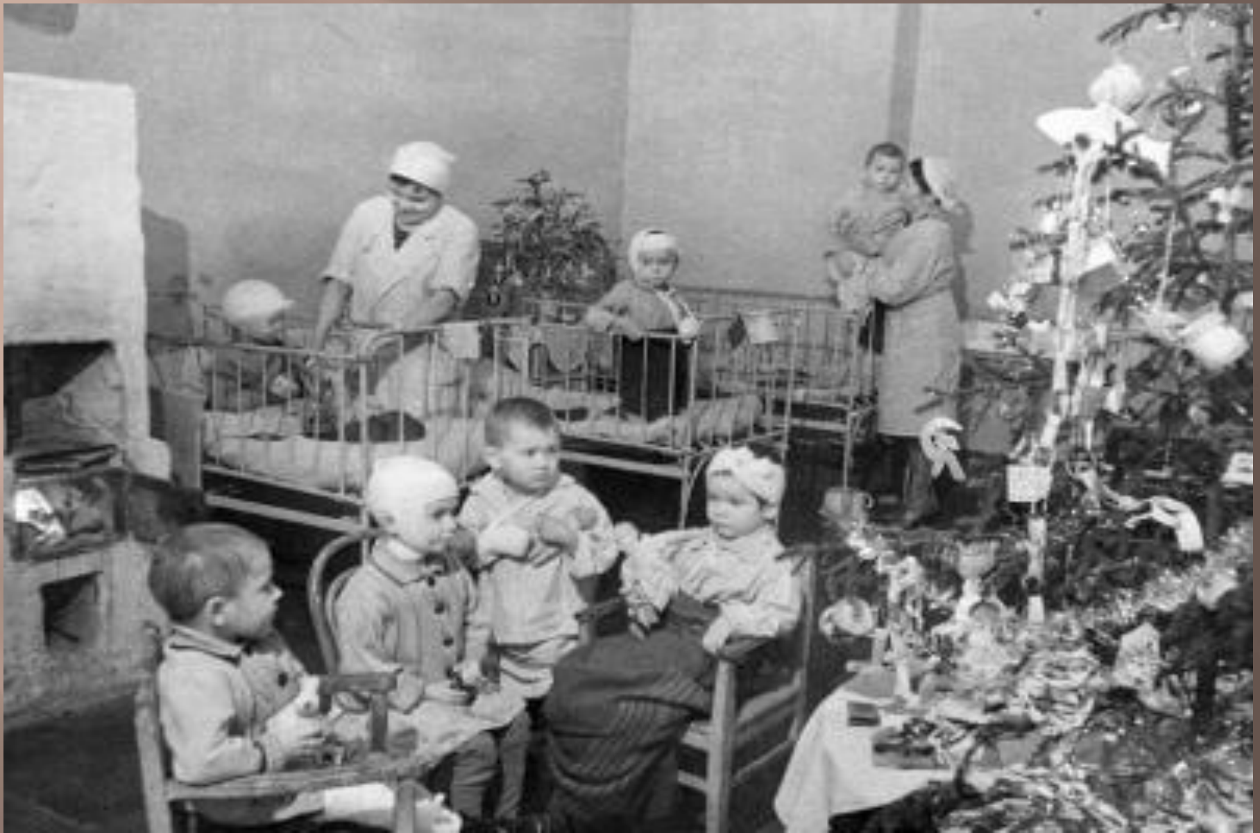
Праздник ёлки в больнице им. К.Раухфуса, который был организован в блокадном Ленинграде для детей, пострадавших от артобстрелов и бомбёжек.