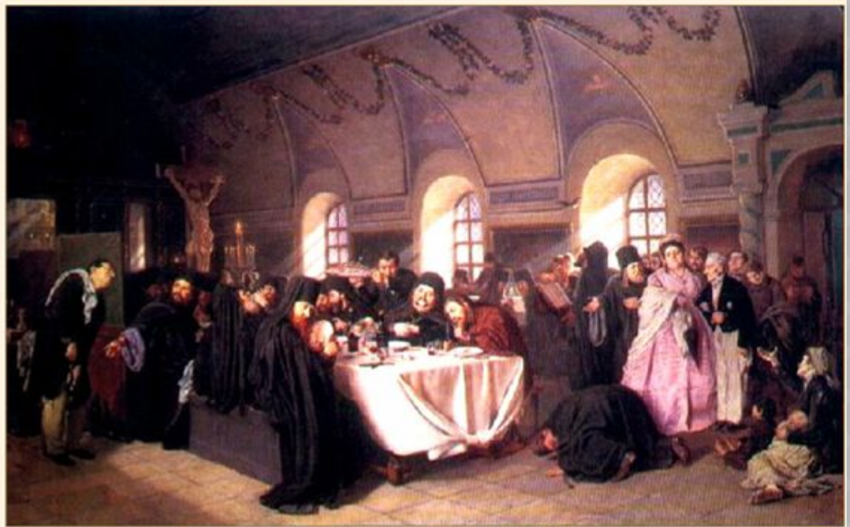
Монастырская трапеза. Художник В. Г. Перов. 1876.