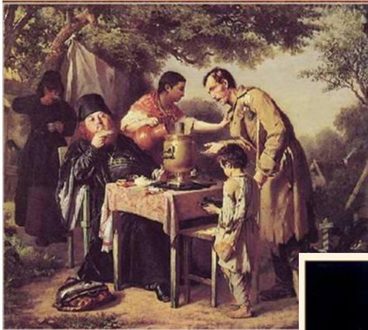
В. Перов. Чаепитие в Мытищах