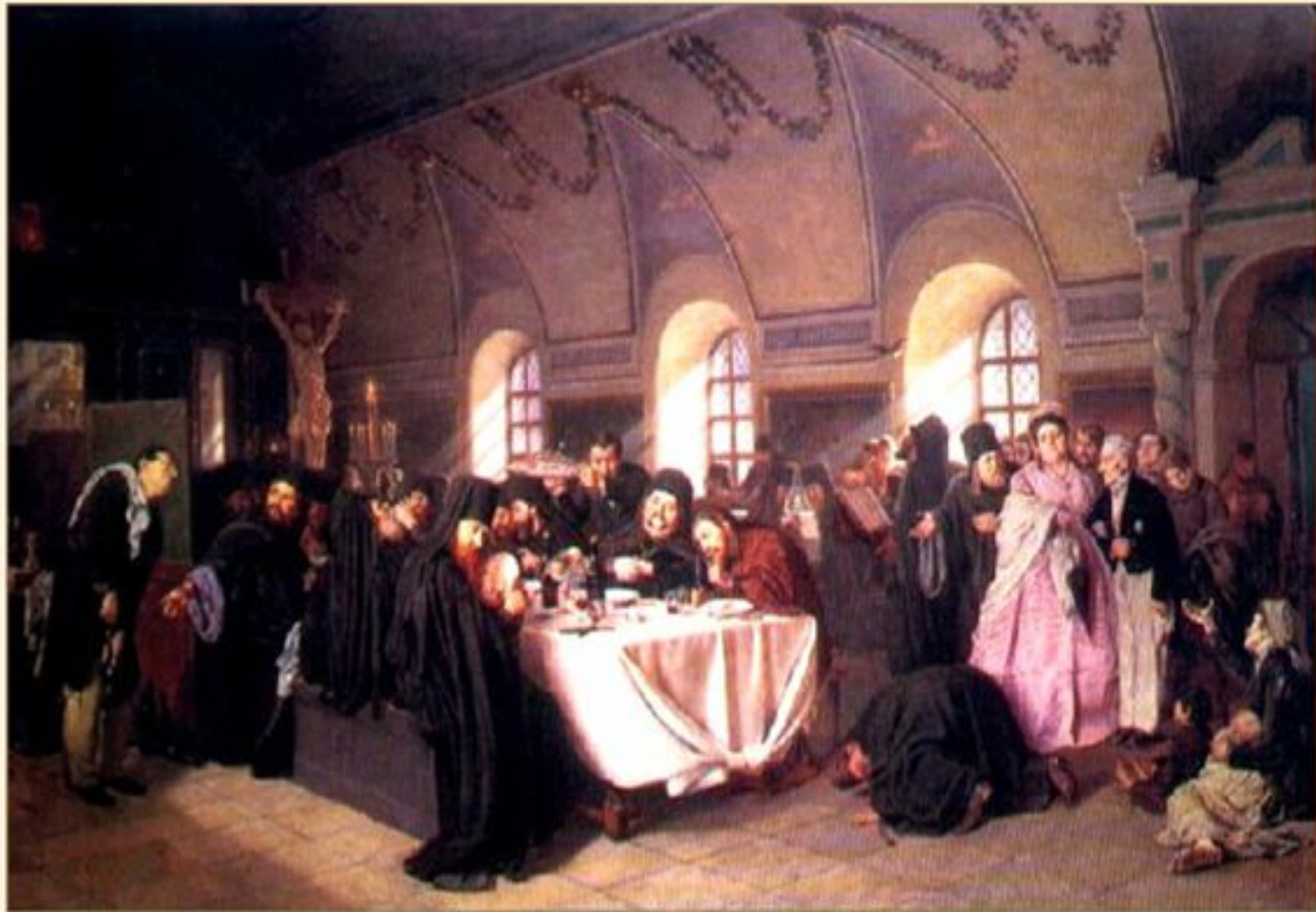
Монастырская трапеза. Художник: В.Г.Перов. 1876.