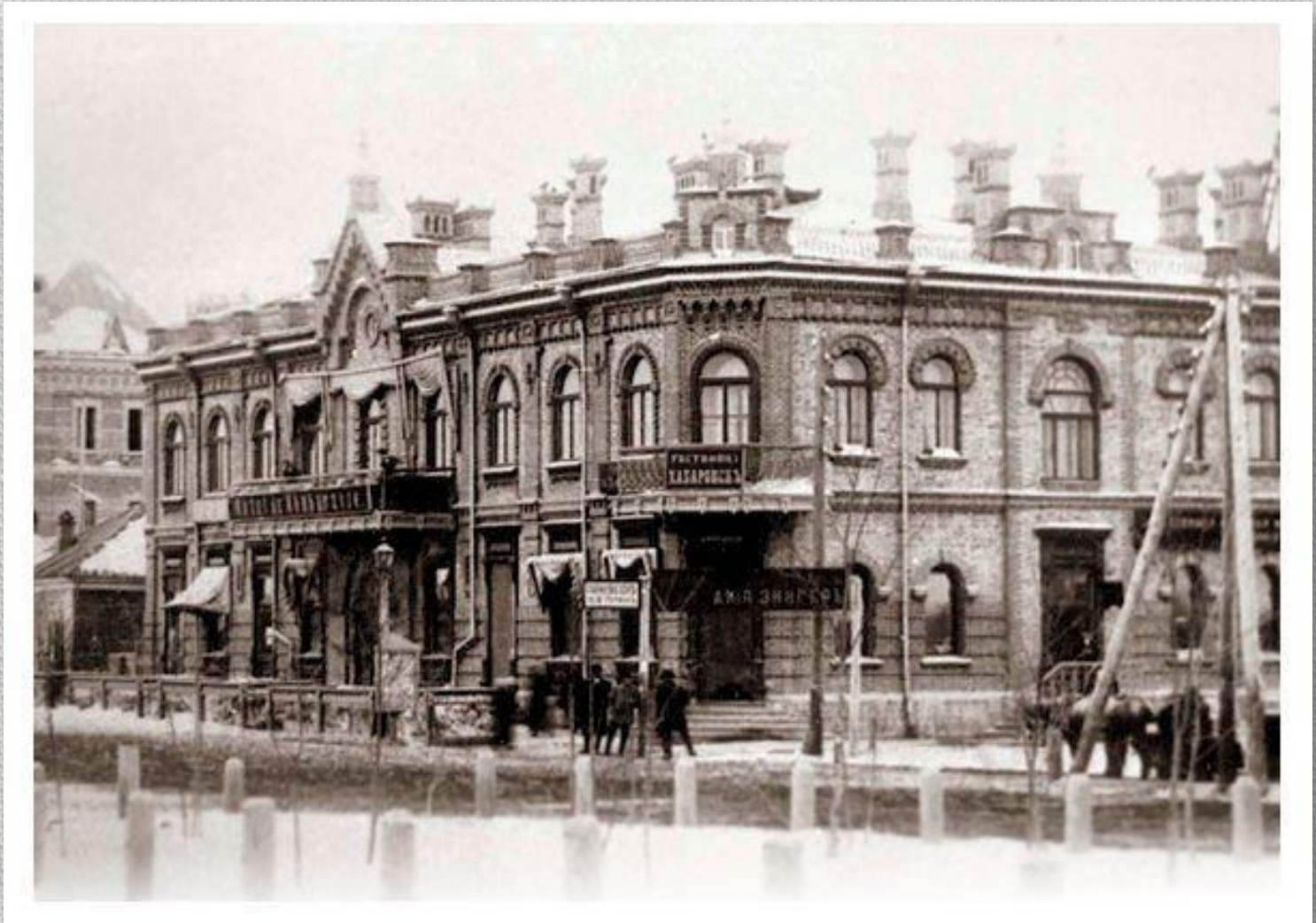
Торговый дом «М.Пьянков с братьями»