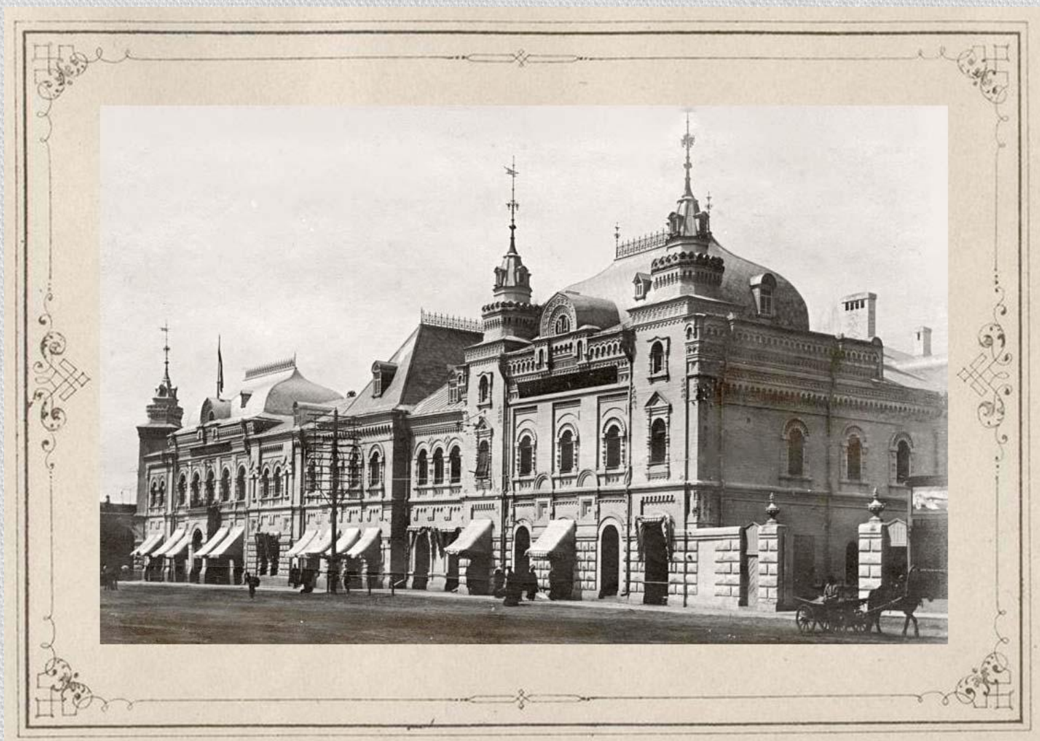
Торговый дом «Кунст и Альберс»