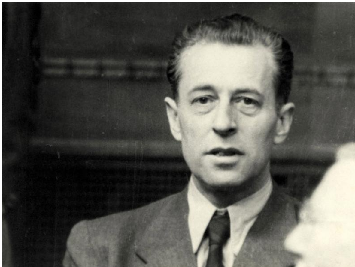
Ганс Фриче - один из оправданных в Нюрнберге.