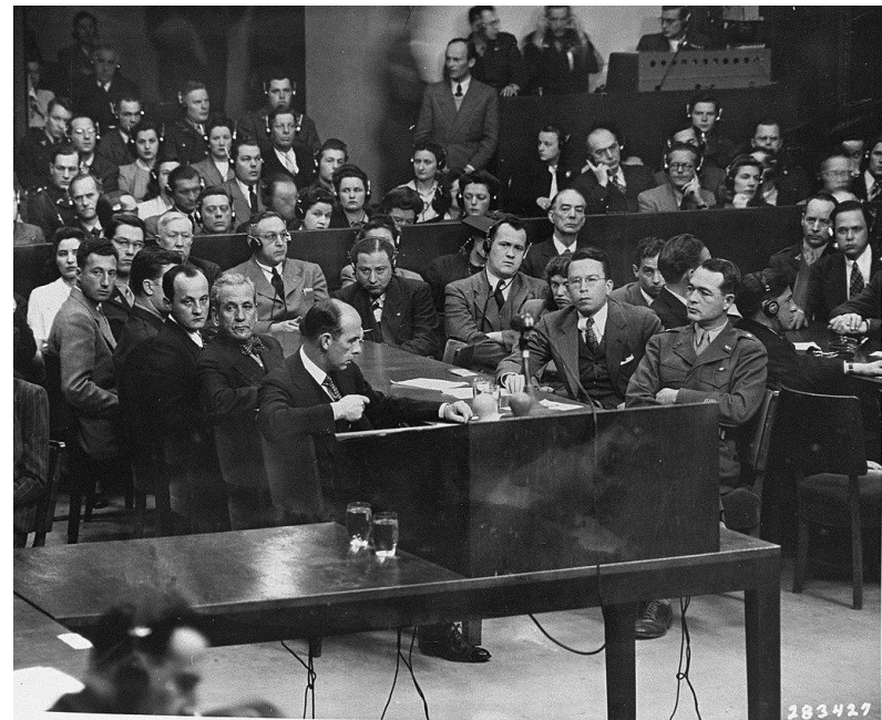
Группа обвинителей по делу Мильха