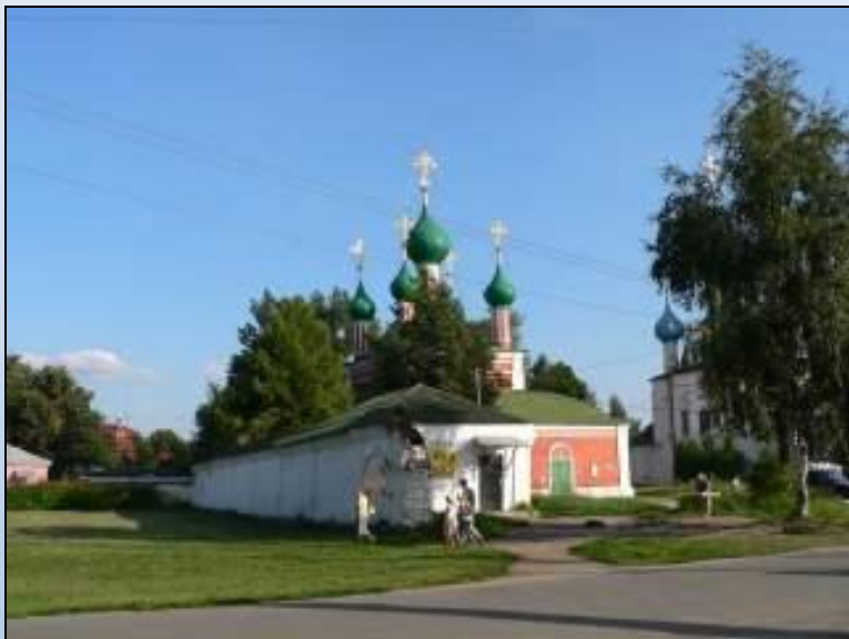
На Соборной площади Переславля-Залесского стоит церковь Александра Невского.

Александр Ярославич Невский родился 30 мая 1219 года в городе Переславле в княжьих теремах рядом со Спасо- Преображенским собором и прожил на свете сорок четыре года и пять с половиной месяцев.