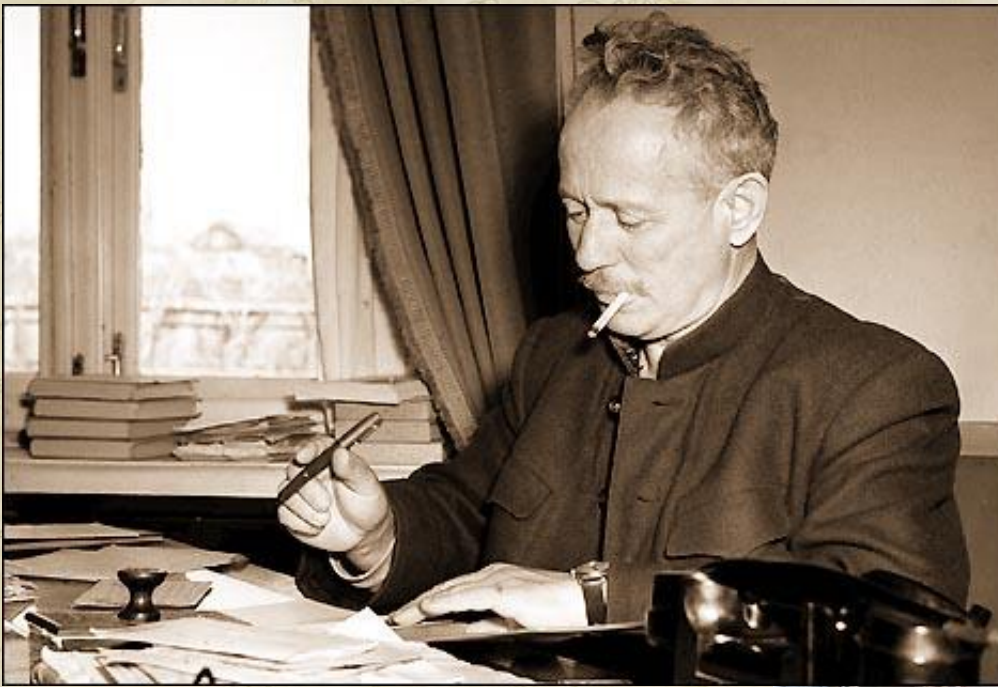
Михаил Шолохов за работой.