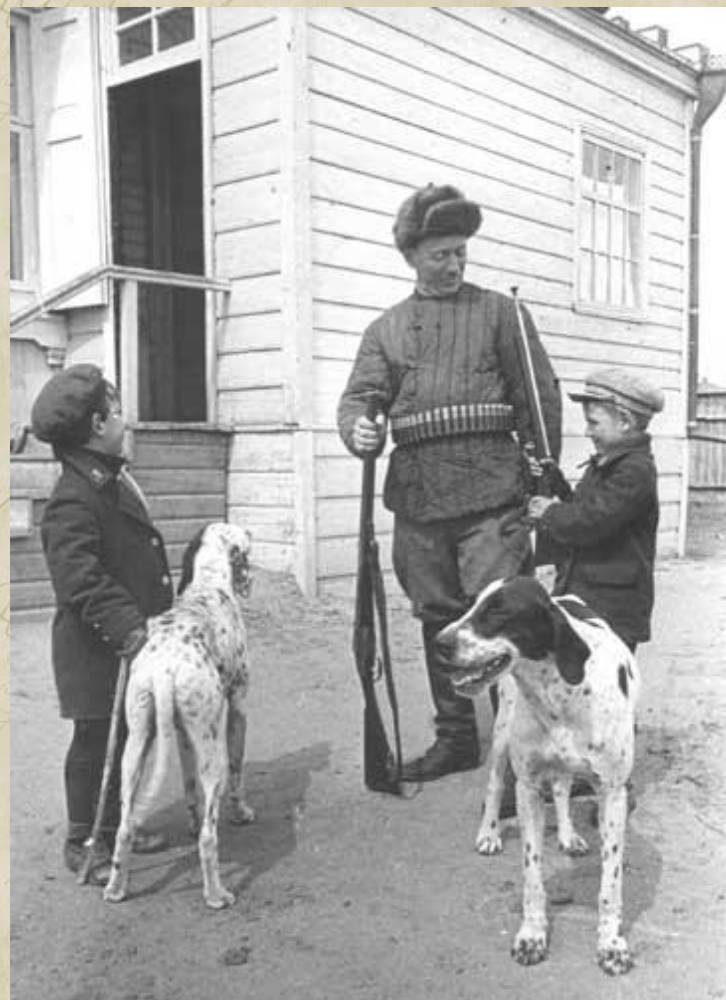
На охоту. Ст. Вешенская