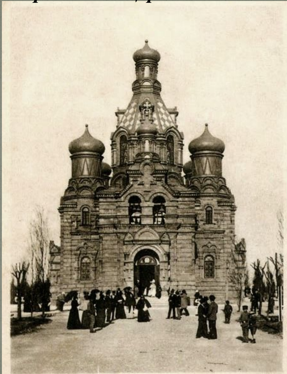
Одесса. Церковь на Новомъ кладбищѣ. Odessa. Eglise au nouveau cimetiѣre.