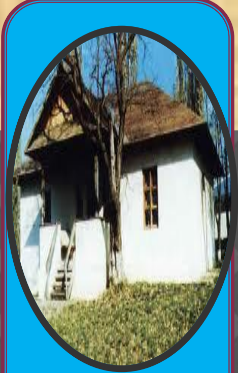
Casa lui Eminescu (din Ipotești)

Într-un registru al membrilor Junimii , Eminescu însuși și-a trecut data nașterii ca fiind 20 decembrie 1849, iar în documentele gimnaziului din Cernăuți, unde a studiat Eminescu, este trecută data de 14 decembrie 1849. Totuși, Titu Maiorescu, în lucrarea Eminescu și poeziile lui (1889) , citează cercetările în acest sens ale lui N. D. Giurescu și preia concluzia acestuia privind data și locul nașterii lui Mihai Eminescu la 15 ianuarie 1850, în Botoșani. Această dată rezultă din mai multe surse, printre care un dosar cu note despre botezuri din arhiva bisericii Uspenia (Domnească) din Botoșani; în acest dosar, data nașterii este trecută ca „15 ghenarie 1850”, iar a botezului la data de 21, în aceeași lună. Data nașterii este confirmată de sora mai mare a poetului, Aglae Drogli, care însă susține că locul nașterii trebuie considerat satul Ipotești.