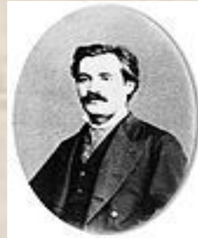
Mihai Eminescu-portret 1878

Este și faza romantică a creației eminesciene. Marilor teme romantice abordate li se asociază acum procedee romantice în stil: structura antitetică a poemelor (“Venere și Madonă”, “Înger și demon”, “Împărat și proletar”, “Epigonii”), acumulările retorice în toate compartimentele stilului, tendința către contraste în alcatuirea figurilor, predilecția pentru caracterul concret al imaginilor, spre deosebire de abstractul caracteristic clasicismului poeziilor din prima perioadă. În revista „Convorbiri literare” va publica poeme precum “Crăiasa din povești”, “Lacul”, “Dorința”, “Făt-Frumos din tei”, “Floare albastră” etc.