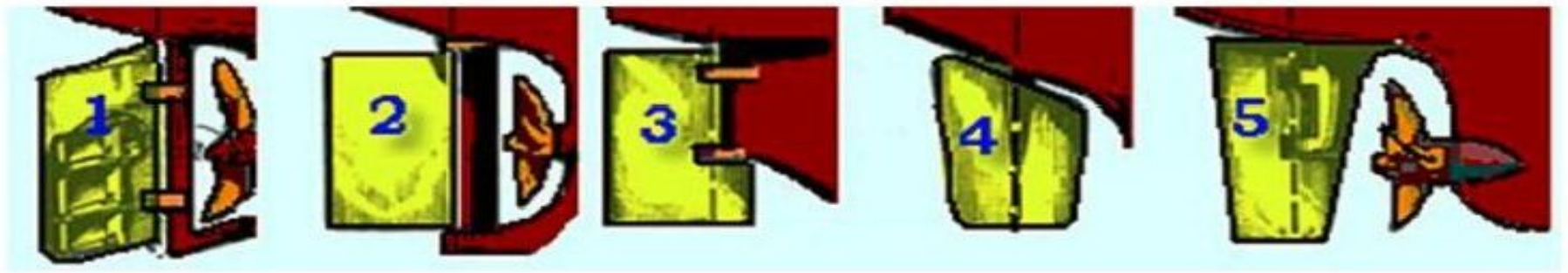
Рис. 6.2. Типы рулей:

1 — обыкновенный руль; 2 — балансирующий руль; 3 — полубалансирующий руль (полуподвесной); 4 — балансирующий руль (подвесной); 5 — полубалансирующий руль (полуподвесной)