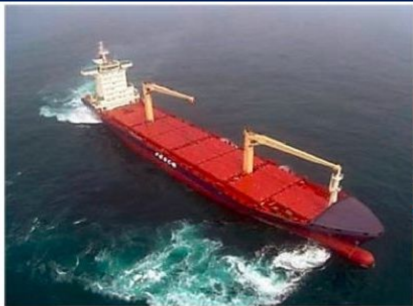
Рис. 6.5. Подруливающие устройства