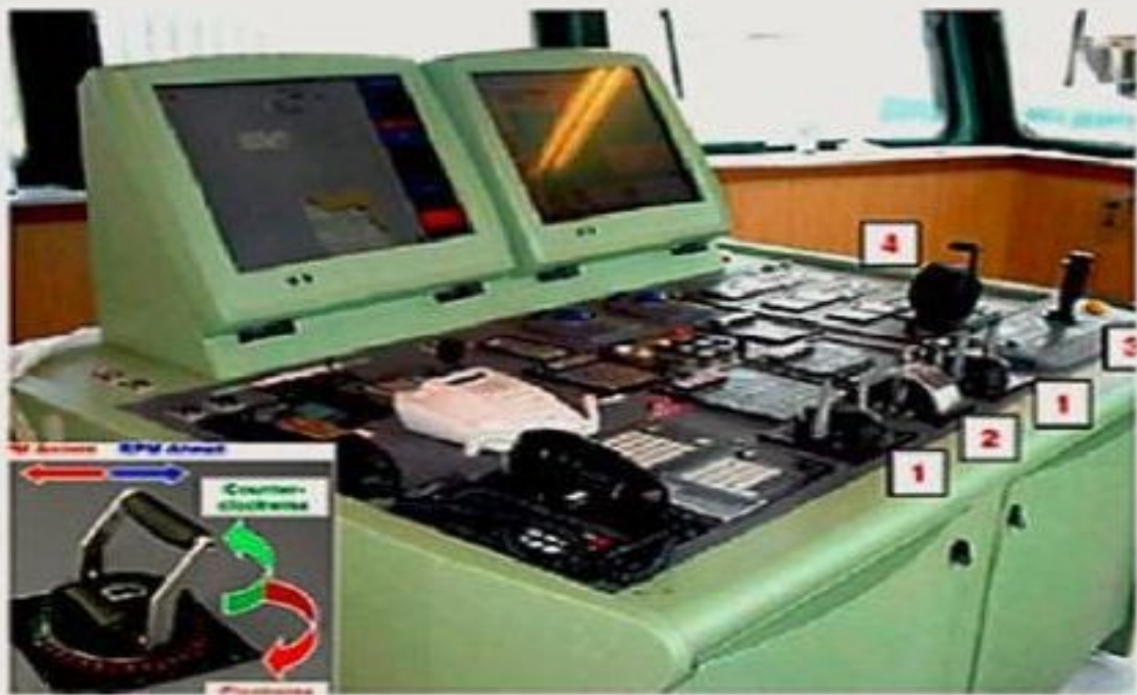
Рис. 6.8. Панель управления судна оснащенного двумя модулями AZIPROD