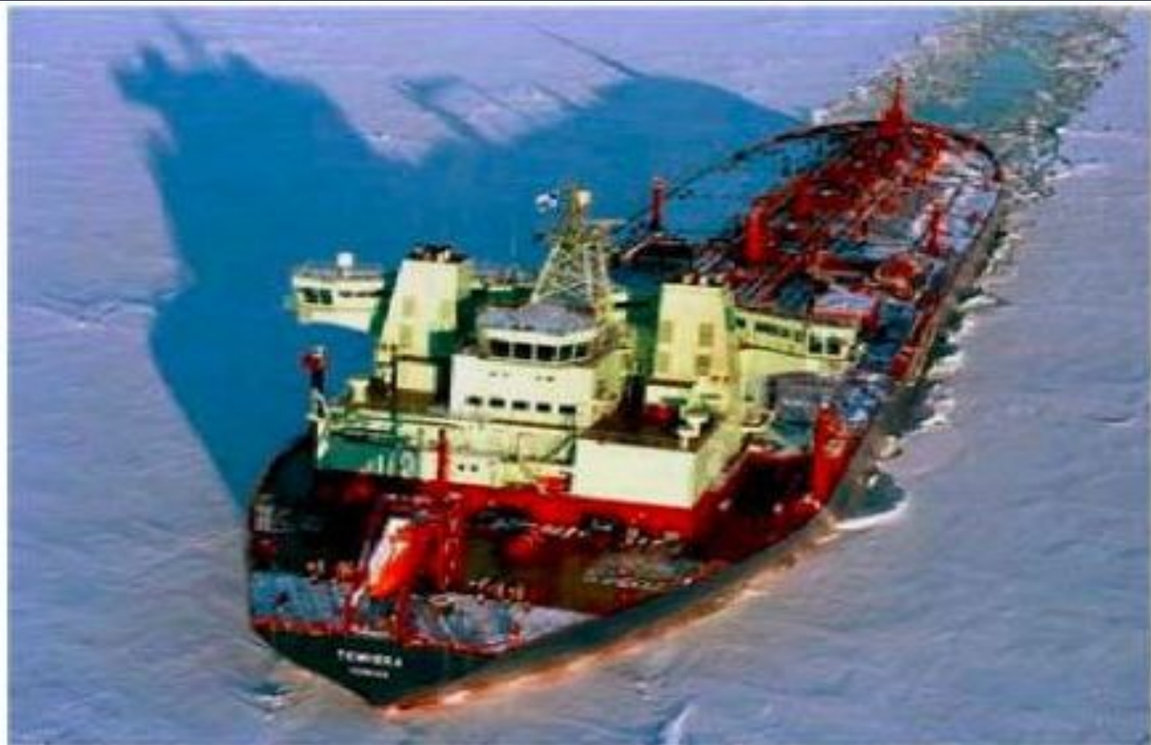
Рис. 6.7. Танкер двойного действия – Double Acting Tanker (DAT) TEMPERA