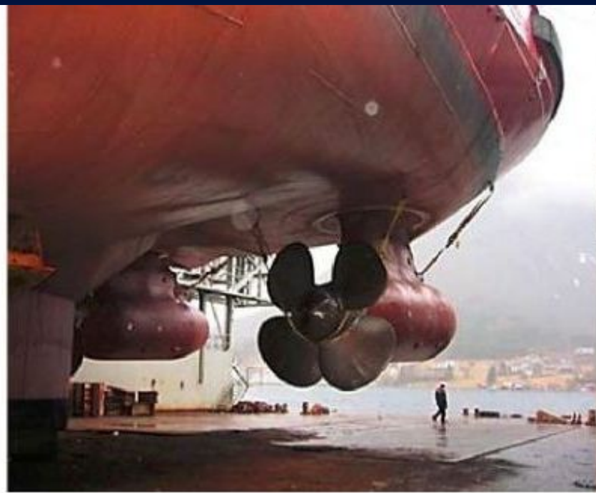
Рис. 6.6. AZIPOD