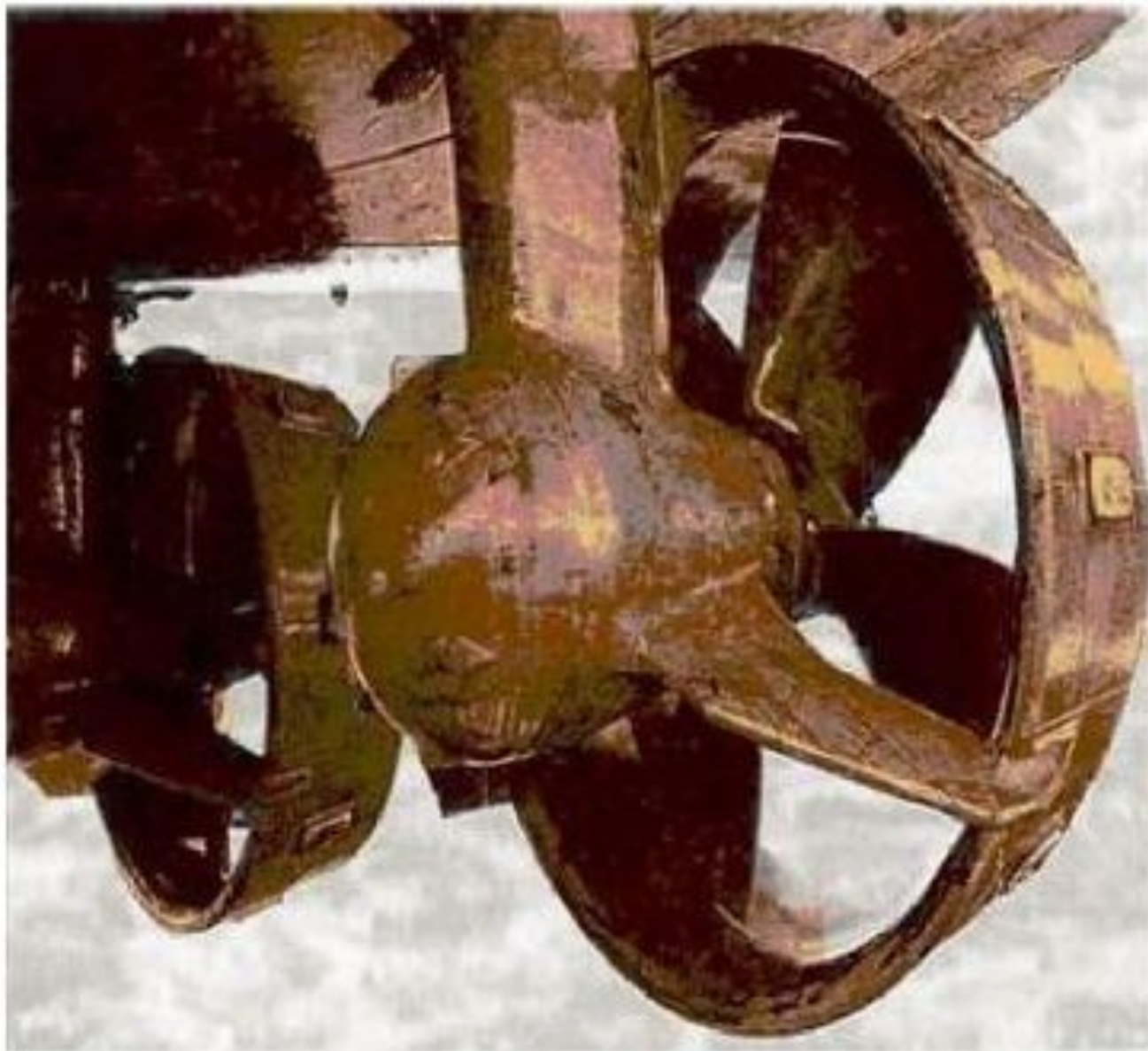
Рис. 6.4. Раздельные поворотные насадки