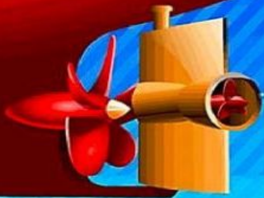
Рис. 6.3. Активный руль