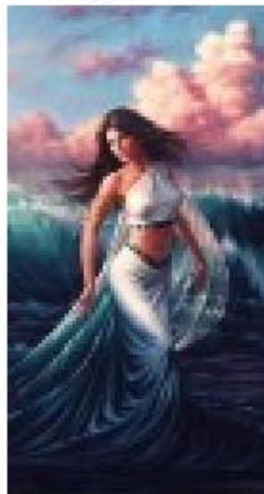
Афродита – богиня любви и красоты