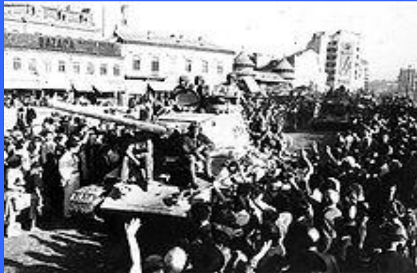
Советские войска вошли в Бухарест 31 августа 1944, через 2 дня после окончания операции.

Наступление советских войск на внешнем фронте все более нарастало. Войска Второго Украинского фронта развивали успех в сторону Северной Трансильвании и на фокшанском направлении, 27 августа заняли Фокшаны и вышли на подступы к Плоешты и Бухаресту. Соединения 46-й армии Третьего Украинского фронта, наступая на юг по обоим берегам Дуная, отрезали пути отхода разбитым немецким войскам к Бухаресту. Черноморский флот и Дунайская военная флотилия содействовали наступлению войск, высаживали десанты, наносили удары морской авиацией. 28 августа были взяты города Брэила и Сулина, 29 августа - порт Констанца. В этот день была завершена ликвидация окруженных войск противника западнее реки Прут. На этом Яско-Кишинёвская операция завершилась.