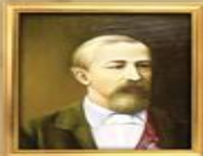
А.П. Бородин 1833-1887