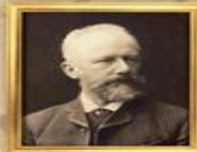
П.И. Чайковский 1840-1893