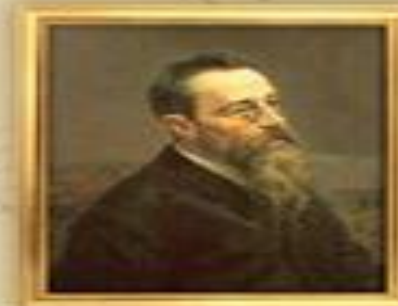
Н.А. Римский-Корсаков 1844-1908