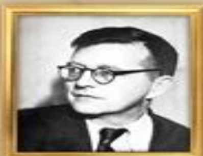
Д.Д. Шостакович 1906-1975