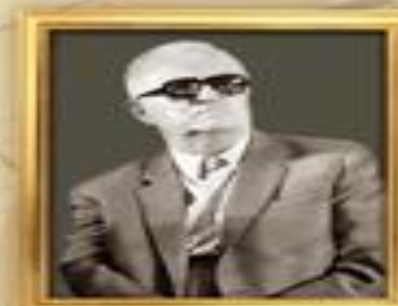
Г.В. Свиридов 1915-1998

"Любите и изучайте великое искусство музыки. Оно откроет вам целый мир высоких чувств. Оно сделает вас духовно богаче. Благодаря музыке, вы найдёте в себе новые, неведомые вам прежде силы. Вы увидите жизнь в новых тонах и красках."