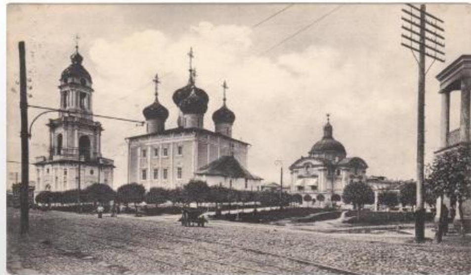
Тверь 19 в.