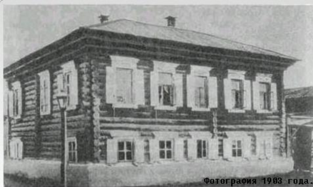
Фотография 1983 года.

Дом в Семипалатинске, где писатель жил с М.Д.Исаевой после женитьбы.