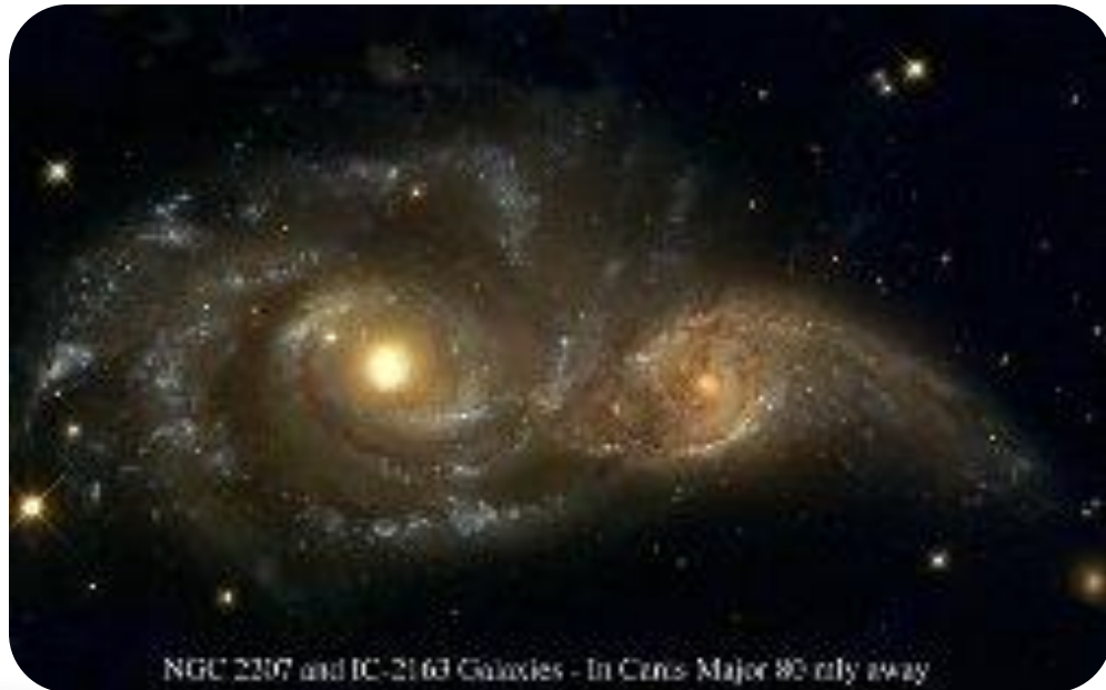
NGC 2207 and IC-2163 Galaxies - In Close Major 80 mly away