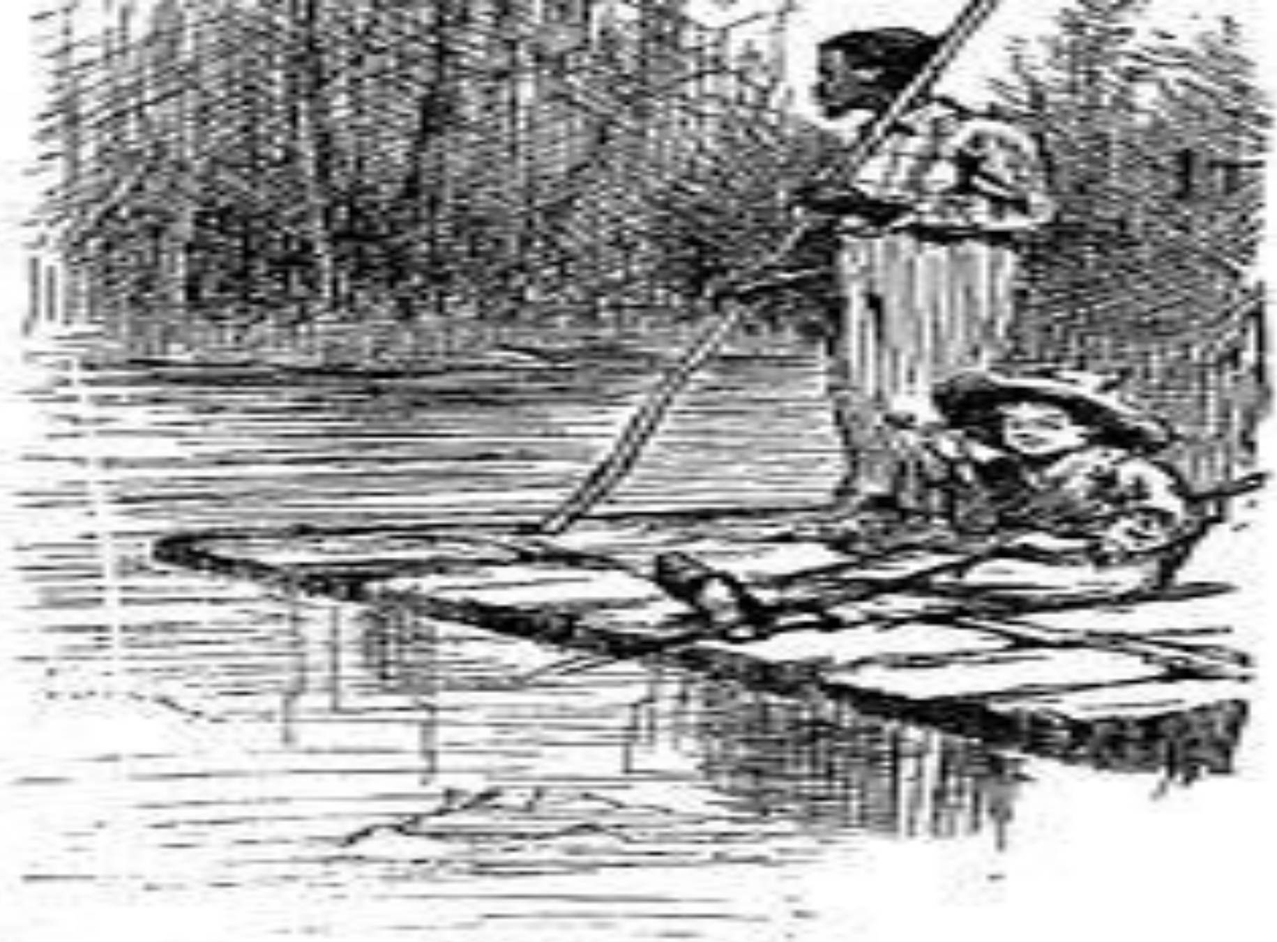
ON THE RAFT.