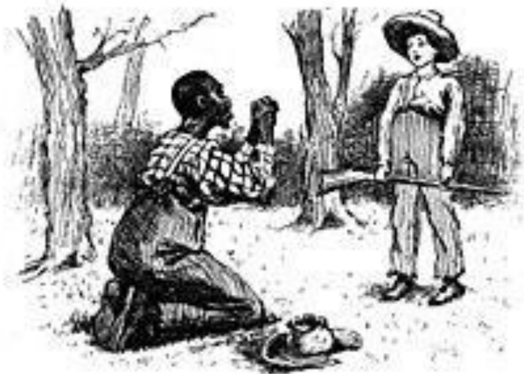
JOHN AND THE WOMAN.