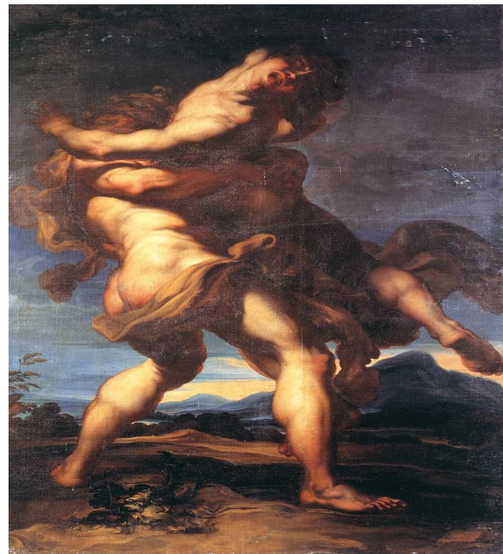
Геракл мен Антейдің айқасы, Gregorio de Ferrari сызған

Грек мифологиясындағы Антей - Посейдон мифі мен Ливия - бербердің осы тектес мифі (грек. Άντι деп аталған) сабақтасып жатқандықтан, тарих атасы Геродот Посейдонды ең алғашында Берберлердің мифі деп, кейін оны Гректер өз мифологиясына қосып алған деп жазады