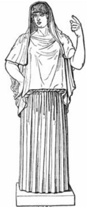
THE GIUSTINIANI HESTIA. (Rome, now in the Torlonia Museum.) [In the original the left hand is nearer the shoulder; the forefinger modern.]

Оның атымен, 1857 жылы ашылған астероид арналған.