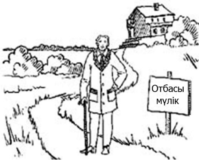
Бірінші келген құқығы