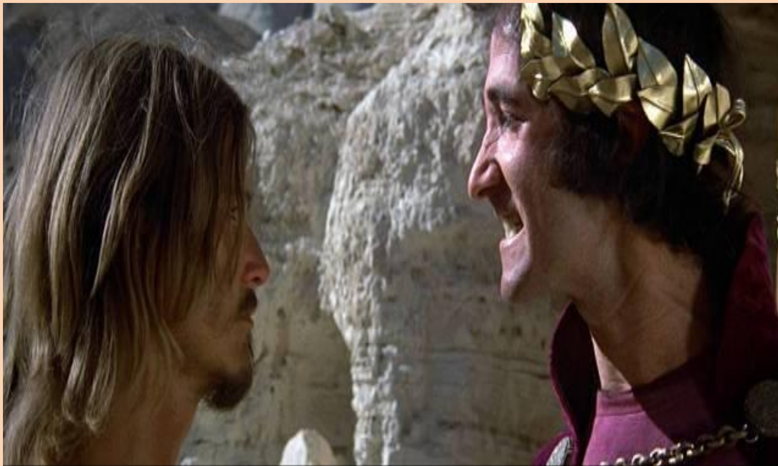
Иисус Христос и Иуда