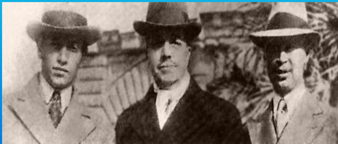
Сергей Лифарь, Сергей Дягилев и Сергей Прокофьев