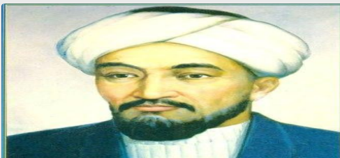
Әл Фараби (870-950)