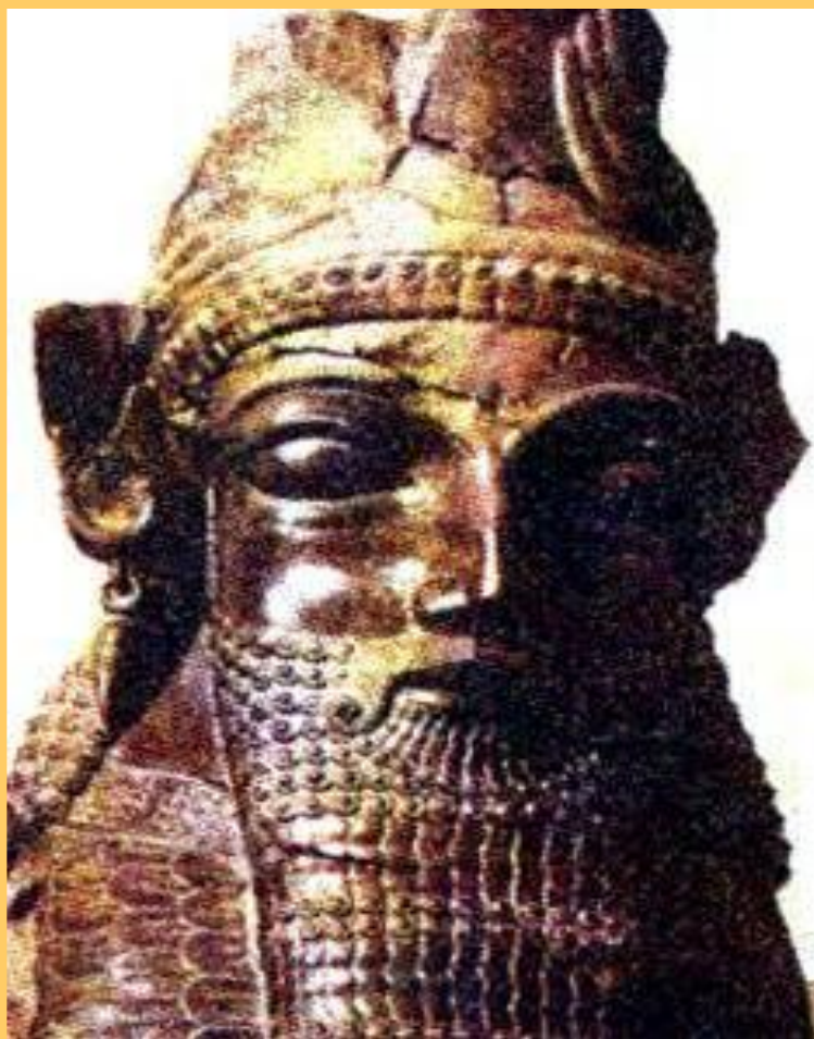
Статуя Дария I.

“Великий бог, который создал небо, землю и человека, Дария сделал царем, единым над многими царями”- говорили персидские мудрецы.