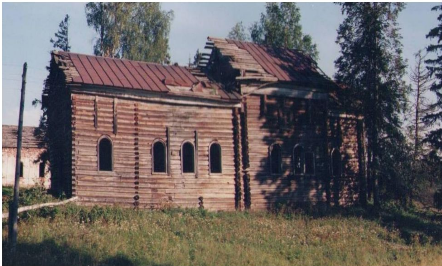
Деревянная церковь Святого Георгия (д. Поповка).