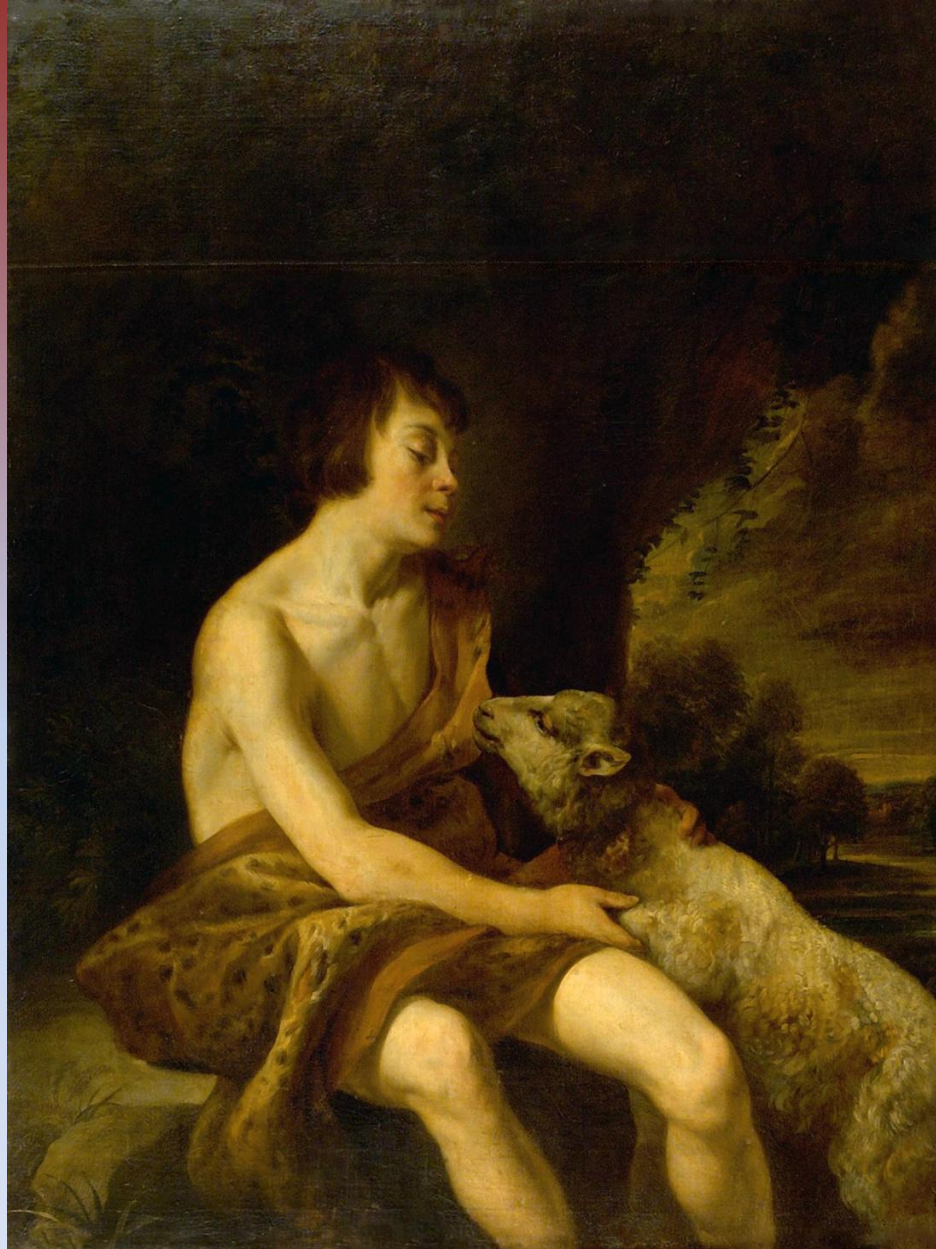
«Иоанн Креститель» Теодор Ромбоутс