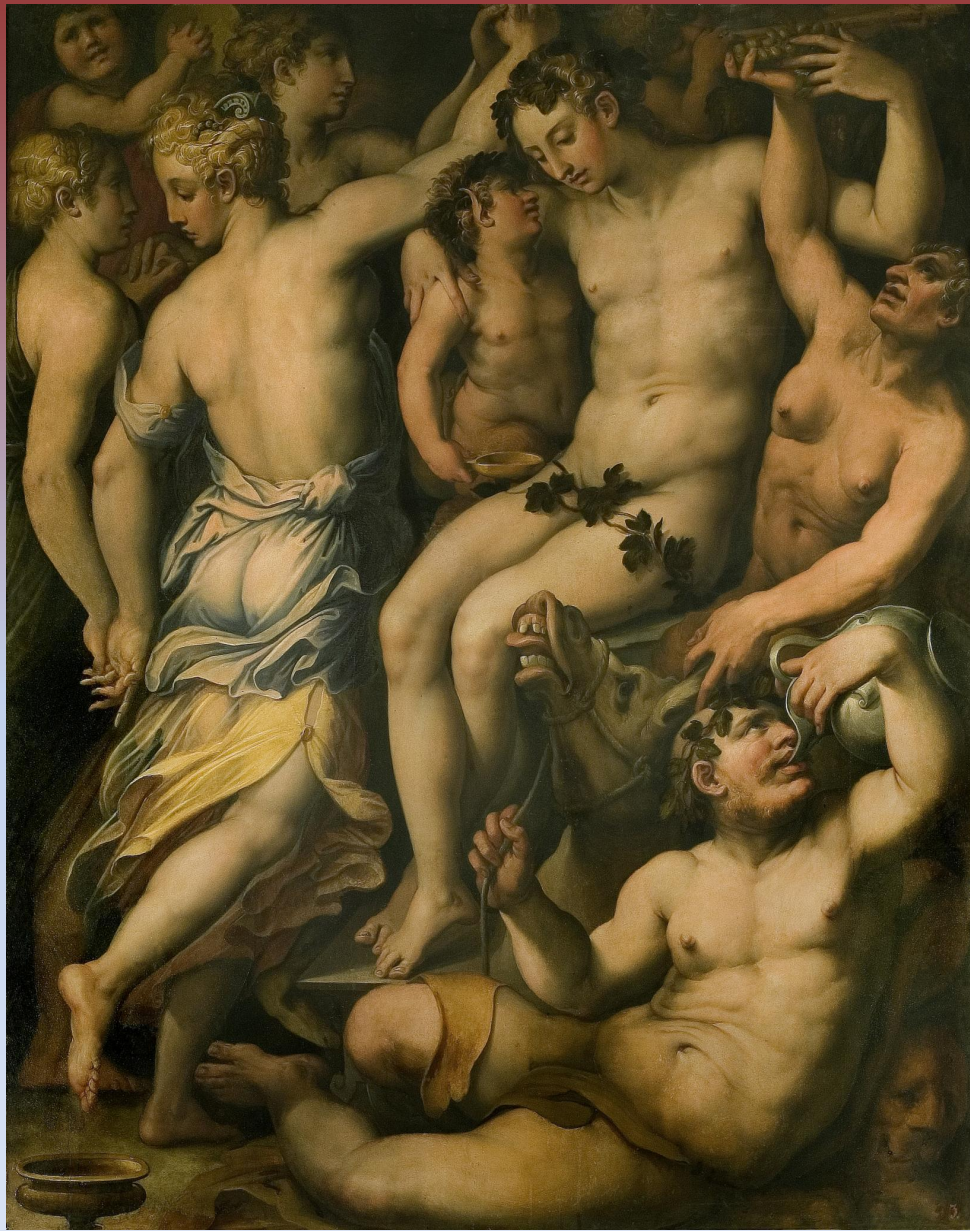
«Триумф Вакха» Джорджо Вазари