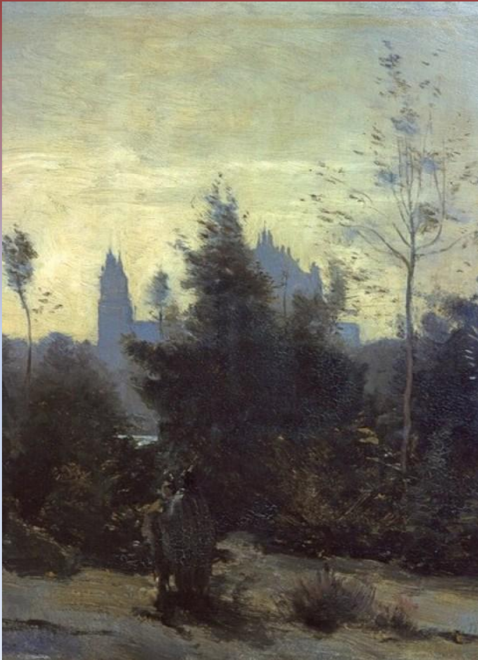
«Коро Жан- Батист- Камиль.» Замок Пьерфон