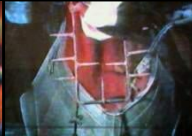
Мундштук с зубьями