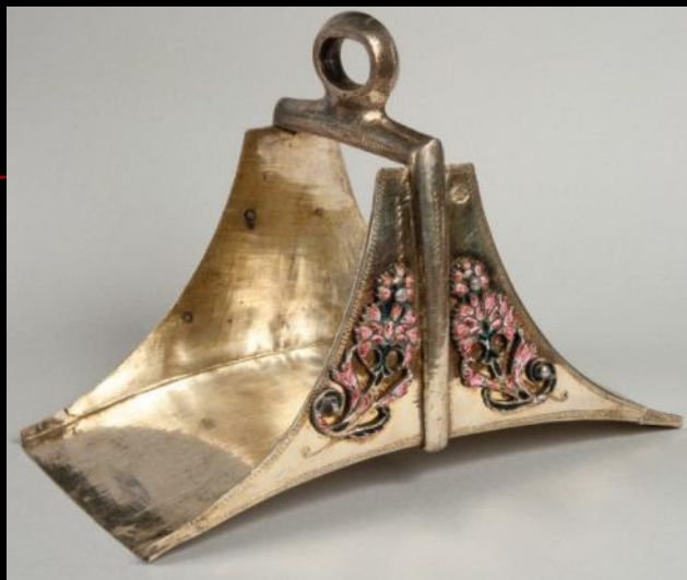
Стремя. Латинские страны. XVII -XVIII века.