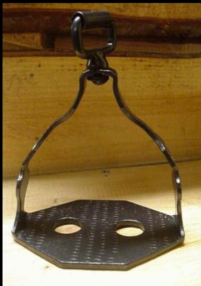
Стремя от Эколь