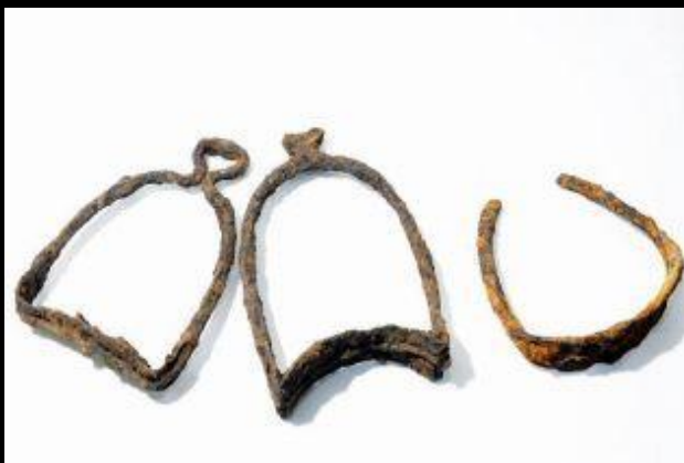
Рыцарские боевые стремя XIV-XV веков.