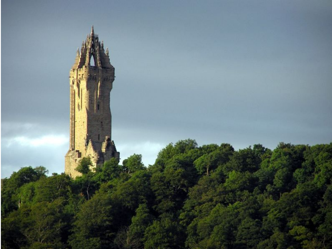
67-метровый неоготический Монумент Уоллеса, построенный в 1869 году шотландским архитектором Джоном Томасом Рокхэдом.