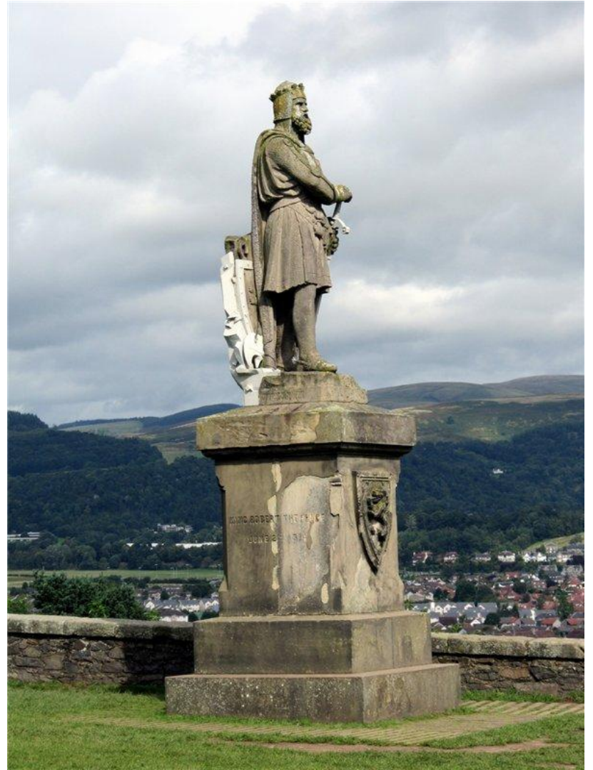
Памятник возведенный в честь Роберта Брюса, стоит у входа в замок Blackness (Тьма) в Стерлинге, Шотландия.