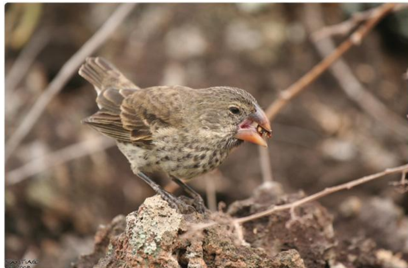
Земляной вьюрок Galapagos Journey.