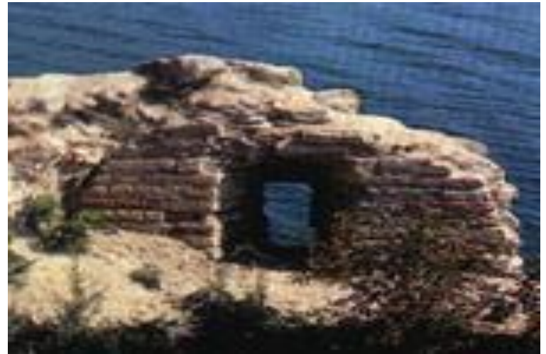
(Бойница Раскатной башни.)