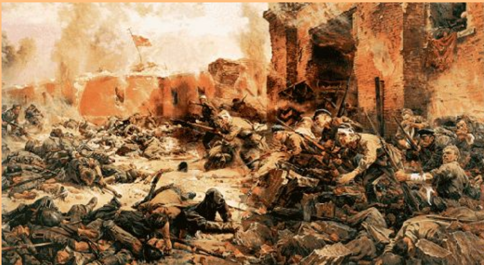
Защитники Брестской крепости. Худ. П. Кривоногов. 1951 г.