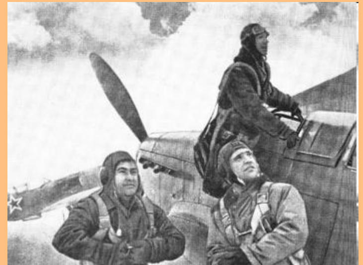
Герой Советского Союза А.П. Маресьев (слева) перед боевым вылетом http://kursk-battle-60.bsu.edu.ru/archives/photoarh/gallery5/photo24.htm