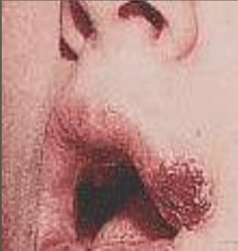
Твердый шанкр на верхней губе человека, больного сифилисом.