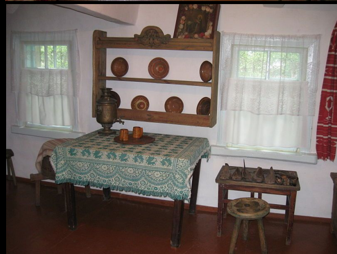
Музей Малишка в Обухові