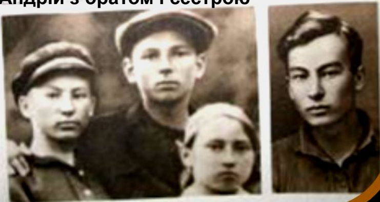
Андрій з братом і сестрою