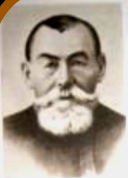
Батько Самійло Малишко